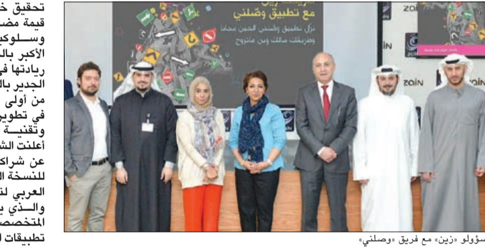
مسؤولو «زين» مع فريق «وصلني»

تحقيق خدمات جيدة ذات قيمة مضافة تخدم توجهات وسلوكيات قاعدة عملائها الأكبر بالشكل الذي يعكس رباتها في السوق الكويتي. الجدير بالذكر أن زين تعتبر من أولى الشركات المهتمة في تطوير مجالات البرمجة وتقنية المعلومات، حيث أعلنت الشركة في بداية العام عن شراكتها الاستراتيجية للنسخة الثانية من «التحدي العربي لتطبيقات الجوال»، والتي يعد أكبر البرامج المتخصصة في مجال برمجة تطبيقات الأجهزة النقالة على مستوى المنطقة العربية، بالإضافة لإطلاقها «تحدي هاتون زين» في عام 2013، والذي فتحت من خلاله آفاقاً جديدة أمام مطوري البرمجيات في مجال الدفع المباشر لفواتير شراء المحتوى والتطبيقات من خلال خطوط الهاتف الذكية، بالإضافة لدعمها مسابقة Imagine Cup بالتعاون مع شركة «مايكروسوفت» في عام 2012، والتي شجعت الشباب على ابتكار تطبيقات للجوال لمواجهة التحديات في مجالات الرعاية الصحية والتعليم التفاعلي والاتصالات والنقل، وقد تم تقديمها من قبل طلبة جامعيين من الكويت. تجنبها، وذلك من خلال تقنية نظام تحديد المواقع GPS التي يمكنها حساب سرعة وموقع المركبة بشكل تلقائي لكي لا يشغل السائق باستخدام الهاتف أثناء القيادة، هذا بالإضافة لإمكانية الإطلاع على الحالة المرورية لمختلف طرق الكويت عن طريق خرائط ثلاثية الأبعاد تعتمد على خرائط Google، وإمكانية البحث عن مواقع أفرع زين وأوقات عملها وكيفية الوصول إليها بأسرع وقت. وأضافت الشركة أن التطبيق نجح في تحقيق أكثر من 100.000 تحميل