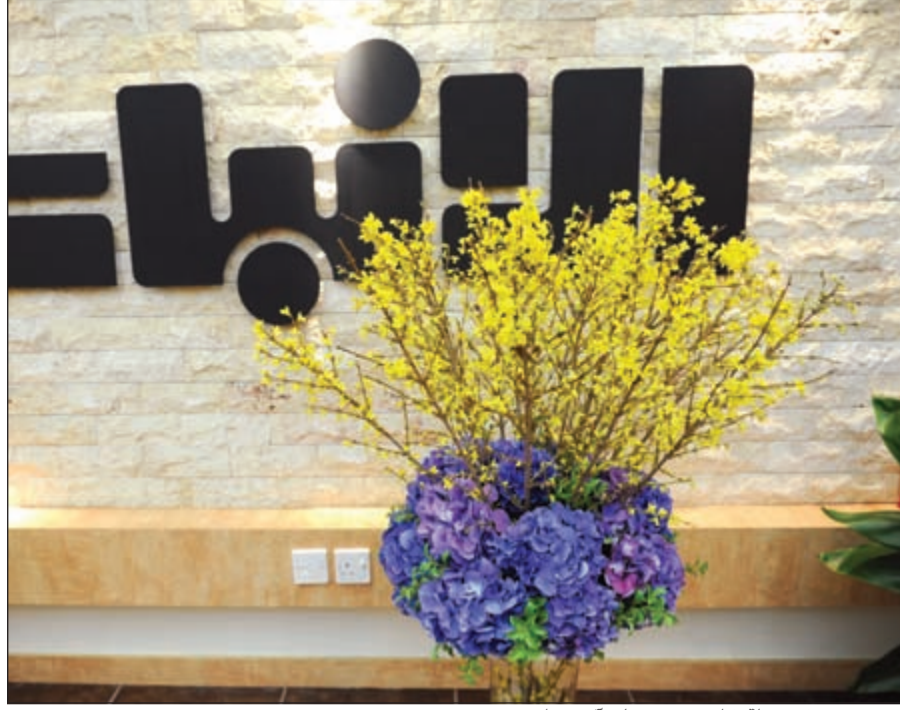
زهور من سفير دولة قطر حمد بن علي آل حنزاب