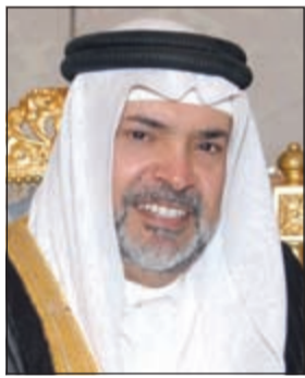
السفير الشيخ خليفة بن حمد