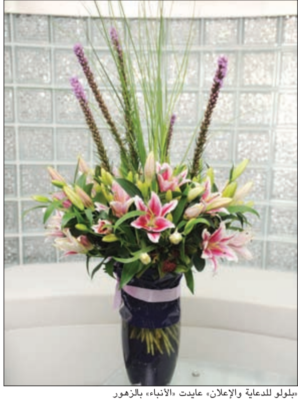
بلولو للدعاية والإعلان، عايدت «الأنباء» بالزهور