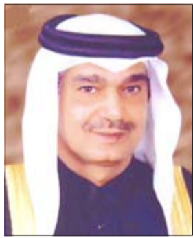
السفير حمد آل خنزاب