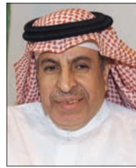
السفير د.عبدالعزیز الفایز