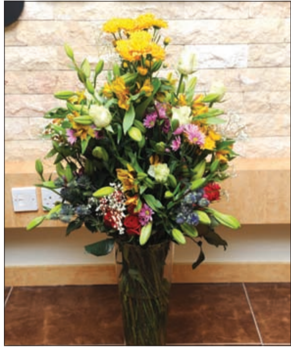
زهور من صقر العوشريجي