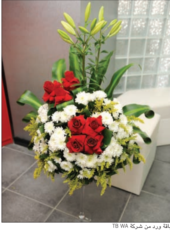
باقة ورد من شركة TB WA