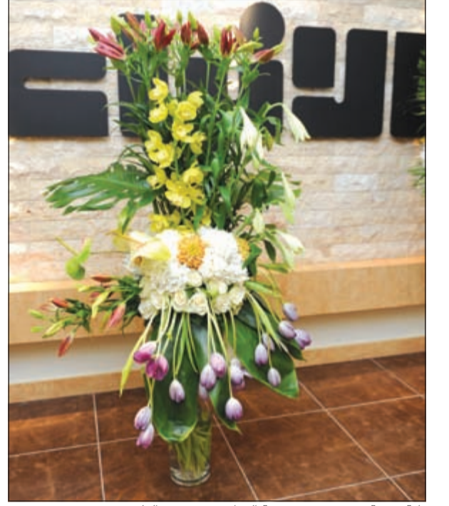
باقة مقدمة من سفير جمهورية العراق محمد بحر العلوم

دور بناء في نقل الكلمة الملتزمة والمنبر الصادق بأسلوب مهني راق