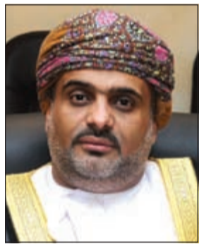
السفير حامد بن سعيد