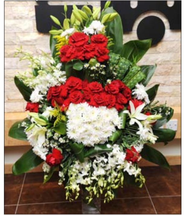
باقة من سفير سلطنة عمان حامد بن سعيد آل إبراهيم

أشاروا إلى دورها في خدمة القضايا الوطنية والعربية والإسلامية