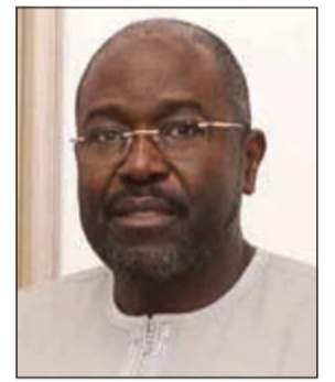
السفير عبدالأحد امباكي

بمزيد من التناقل والنجاح. تنمية العلاقات ومن جهته أيضا، بارك سفير جمهورية العراق لدى الكويت السفير محمد بحر العلوم لـ «الأنباء» في عيدها الـ 39 قائلا: الأخ الفاضل الأستاذ يوسف خالد المرزوق المحترم رئيس تحرير جريدة «الأنباء» والسلام عليكم ورحمة الله وبركاته.. يطلب لنا وبمناسبة الذكرى الـ 39 لصدور العدد الأول من جريدتكم «الأنباء» الغراء، أن ننهن هذه الفرصة الطيبة لنقدم لكم ولجميع الإخوة العاملين بمؤسستكم الإعلامية بازكي التهاني وأطيب التبريكات بهذه المناسبة الطيبة متمنين لكم المزيد من التقدم والنجاح، ولبلدكم العزيز الشقيق دولة الكويت دوام الرفعة والازدهار. ويسرنا بهذه المناسبة الطيبة أن نعرب لكم عن تقديرنا واعتزازنا لمستوى الإعلام المتميز الذي تتسم به جريدتكم، والجهود التي يبذلها العاملون بها مما يجعلها شامخة في المجال الإعلامي والحافلة بعطائها تخدم به القضايا العربية والإسلامية، وفي هذا المجال نشيد بدور جريدتكم في تنمية علاقات بلدنا الشقيق العراق والكويت وما قدمته من خدمة ورؤية إعلامية صادقة تخدم المسار الذي سارت به علاقات البلدين الشقيقين، ندعو من العلي القدير لكم بمزيد من التوفيق لتحقيق أهدافكم السامية وغاياتكم النبيلة.