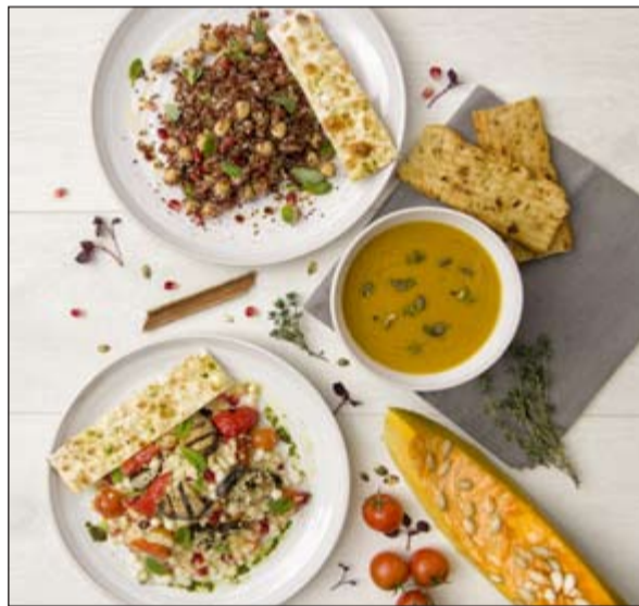
أشهى المأكولات الصحية من «دين & ديلوكا»