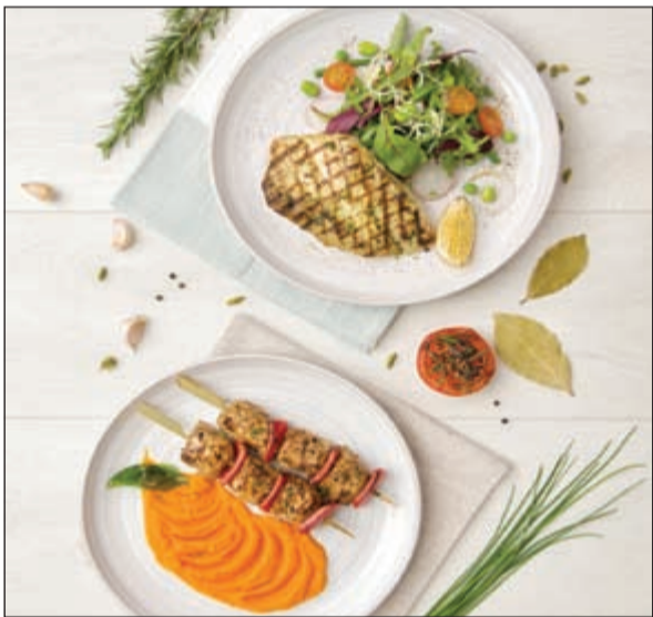
طعام صحي لحياة سليمة