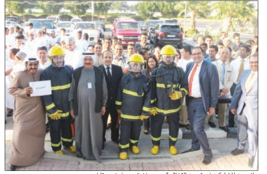
جانب من المشاركين في تمرين الإخلاء الوهمي بفندق سيففوني ستايل