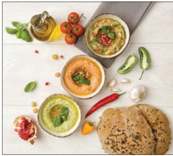
طعم لا يقاوم

الأصلي في سبتمبر من عام 1977 في سوهو، ويعد من أشهر أوجه الثقافة وأسلوب الحياة في مدينة نيويورك. يشتهر بكونه مركز اكتشاف أشهر أساليب الطهو العصرية والتقليدية الرائعة، وتعتبر دين & ديلوكا العلامة الأفضل بتقديم أشهى المأكولات حول العالم، مع مجموعة واسعة من المنتجات الغذائية اللذيذة وأشهى الأطباق الفريدة من نوعها، حيث كل منتج يروي قصة مختلفة.