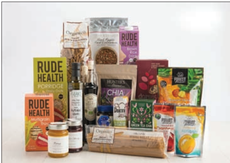
من منتجات «دين & ديلوكا» الصحية