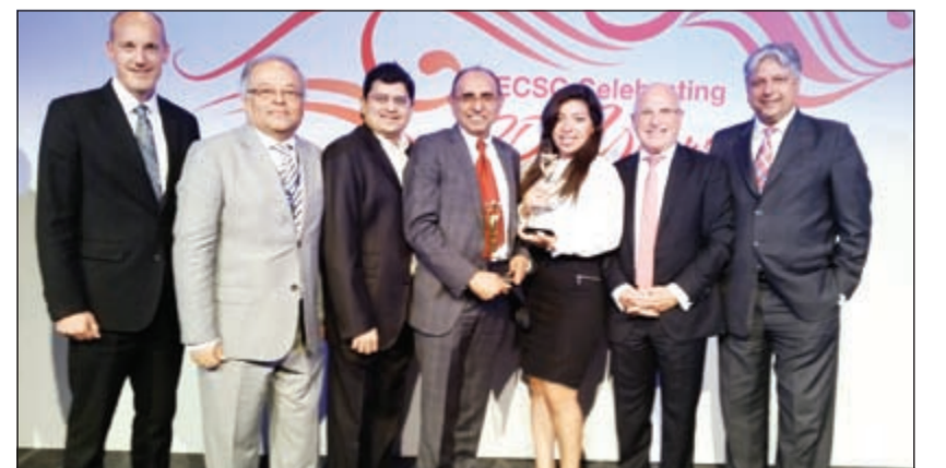
تسليم الجائزة لإدارة «الكوت»

فاز «الكوت» بالجائزة الفضية في الحفل السنوي لمجلس مراكز تسوق الشرق الأوسط لعام 2014 لفئة الحملات التسويقية والترويجية وذلك عن برنامج «صحية الكوت» من خلال حفل كبير أقيم مؤخرا في فندق «ريتز كارلتون» دبي وسط حشد كبير من أهم الشخصيات في مجال مراكز التسوق بالشرق الأوسط وشمال أفريقيا. وبرنامج «صحية الكوت» هو البرنامج الأول من نوعه بالكويت وخصص بالسيارات، حيث تم تخصيص يوم الثلاثاء للسيدات لتقديمهن عروضاً وخصومات خاصة ودروساً متنوعة مثل