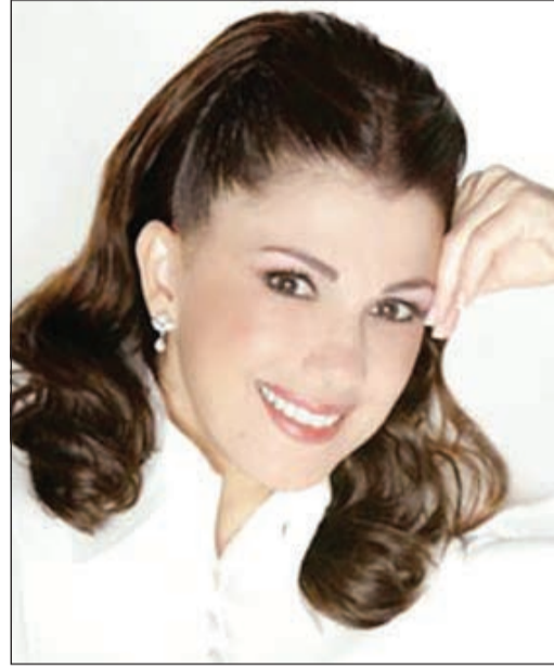
الفنانة ماجدة الرومي