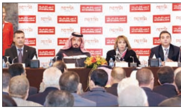
جانب من المؤتمر الصحافي

شركة طيران راسخة مثل «البتراء للطيران» تحمل في طياتها فوائد كثيرة من الناحية التجارية والتشغيلية، والتي شأنها أن تمكن «العربية للطيران الأردن» من استغلال كامل إمكانياتها في فترة زمنية قصيرة. ومن هنا، نود أن نتقدم بالشكر الجزيل إلى السلطات المحلية ووزارة النقل الأردنية على دعمهم اللامحدود في سبيل إطلاق هذا المشروع الجديد».