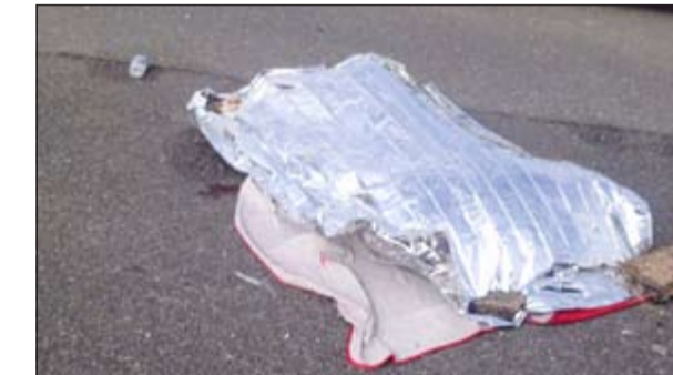
جثة الخليجي على طريق السالمي

وقع حادث تصادم مرووع ظهر امس على طريق السالمي السريع راح ضحيته شاب خليجي 37 عاماً وتم نقل الجثة إلى الطب الشرعي.