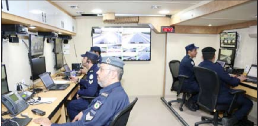
غرفة العمليات من الداخل