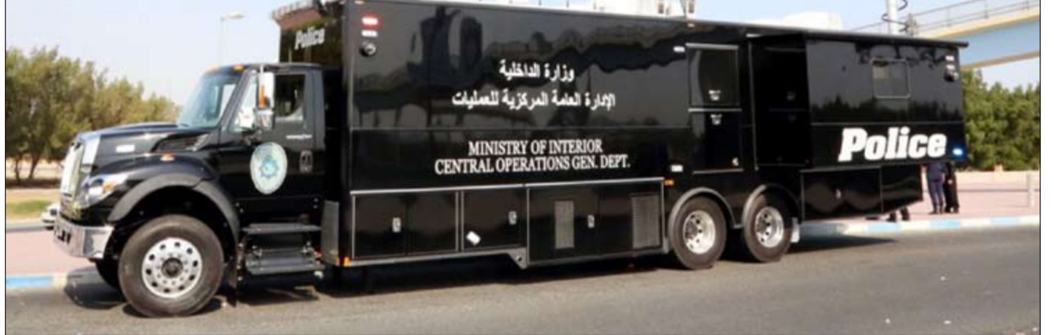
غرفة العمليات الأمنية الميدانية التابعة لإدارة العامة المركزية للعمليات