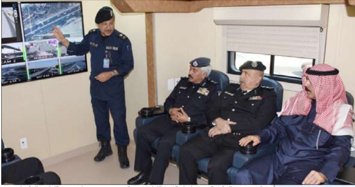
الشيخ محمد الخالد والفريق سليمان الفهد واللواء محمود الدوسري يستمعون لشرح من اللواء جمال الصايغ