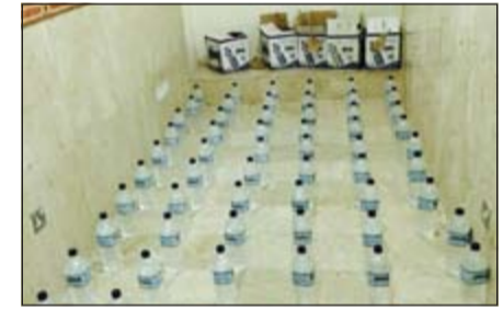
الخمور التي تم ضبطها

أوقف رجال امن مديرية الاحمدي بتعليمات من اللواء علي المري وأفاد من شرق آسيا وبحوزته 56 بطل خمر محلي في منطقة المنقف وتمت إحالته إلى جهة الاختصاص. وقال مصدر امني ان دورية كانت في جولة اعتيادية بقيادة العقيد صالح العازمي والرائد سلمان المطيري واشتبها بمركبة في منطقة المنقف، وعند الطلب من قائدها التوقف لأذ بالفرار، الا ان فراره لم يستمر سوى 5 دقائق ليتم القاء القبض عليه وتبين انه لا يحمل اي إثبات، ويتفتيش سيارته تمهيدا لإحالتها إلى الحجز عثر بداخلها على 56 بطل خمر محلي كبير الحجم تم التحفظ عليها.