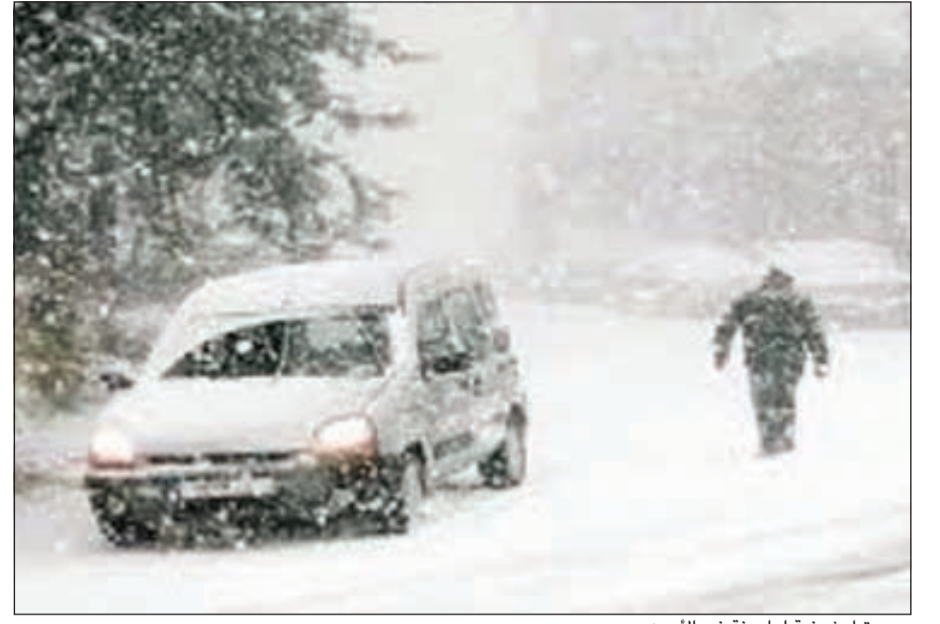
صورة أرشيفية لعاصفة في الأردن

وقال المحقق مارك نوفيلد إن، بهو لام، أودع الطفلين لدى أحد أقاربه ظهر الاثنين، وهذا الشخص هو الذي حذر الشرطة ليلا من سلوك «رجل مضطرب» قد يقدم على الانتحار، وبالفعل فإن بهو لام قتل نفسه في اليوم التالي في مطعم فينتامي كان يعمل فيه.