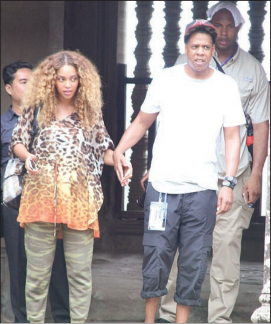
بيونسيه وزوجها في كمبوديا