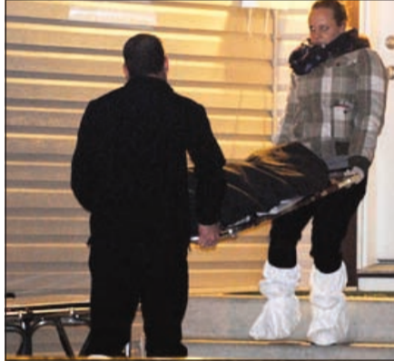
أحد ضحايا المجزرة

مونتريال - أ.ف.ب: بينت التحقيقات الأولية أن المأساة العائلية التي راح ضحيتها قبل أيام في كندا ثمانية أشخاص بينهم طفلان برصاص رجل ما ليث أن انتحر، تعود أسبابها إلى الغيرة الزوجية.