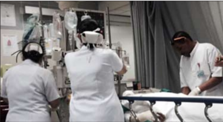
أحد المصابين الخمسة يتلقى العلاج في طوارئ مستشفى الجھراء

من جهته، قال مصدر أمني إن بلاغا ورد إلى غرفة عمليات الداخلية مساء أمس الأول عن حريق مطعم في منطقة العمار الاستثمارية بمحافظة الجھراء وعليه توجه رجال الإطفاء والإسعاف وتم نقل المصابين إلى مستشفى الجھراء حيث كان في استقبالهم ضابط