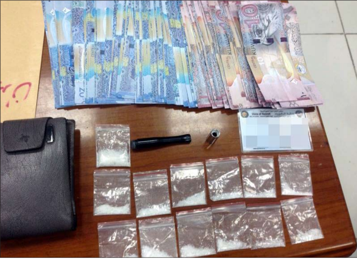
كمية المخدرات والنقود المزورة التي ضبطت بحوزة المتهم