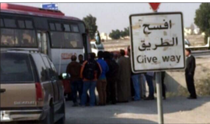
نقطة تفتيش أقيمت خلال حملة الجھراء أمس الأول

من جهته، قال مصدر أمني إن بلاغا ورد إلى غرفة عمليات الداخلية مساء أمس الأول عن حريق مطعم في منطقة العمار الاستثمارية بمحافظة الجھراء وعليه توجه رجال الإطفاء والإسعاف وتم نقل المصابين إلى مستشفى الجھراء حيث كان في استقبالهم ضابط