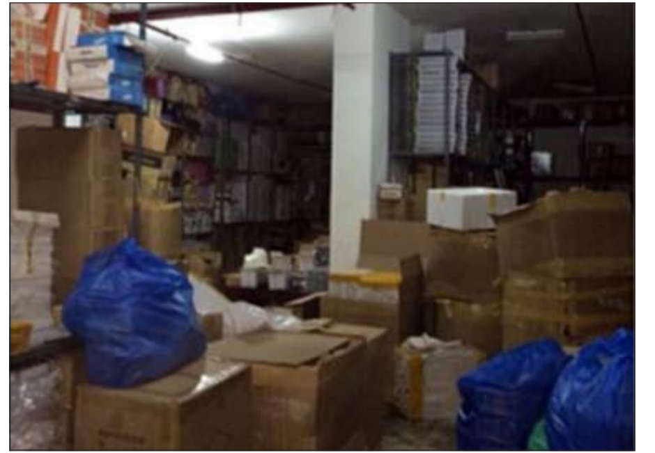
السرداب الذي سجلت بحق مالكه مخالفة إطفائية بالفروانية أمس

أن يكون المخزن هو مصدر الحريق خاصة إذا كان يقتدر لأدنى مقومات الأمن والسلامة بحسب ما أوضح مصدر إطفائي للأنباء وقال: «قمنا أمس بتحرير مخالفة واحدة لسرداب في بناية تقع بمنطقة الفروانية، وستستمر حملاتنا حفاظا على أرواح الأبرياء من سكان تلك البنايات التي يستغلها أصحابها لتأجير السرايب كمخازن».