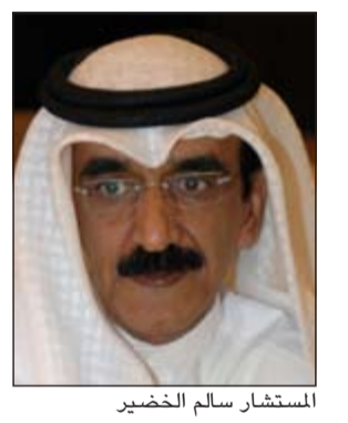
المستشار سالم الخضير

أسدلت الدائرة الجزائية الثانية بمحكمة التميز أمس برئاسة المستشار سالم الخضير الستار على قضية أمن الدولة رقم 22/ 2012 المرفوعة ضد المغرد والنشاط صقر الحشاش بان عدلت الحكم إلى الحبس سنة وثمانية أشهر بدلا من الحبس سنة. كانت الدائرة الجزائية بالمحكمة الكلية قد قضت في 7/ 31/ 2013 بحبس الحشاش