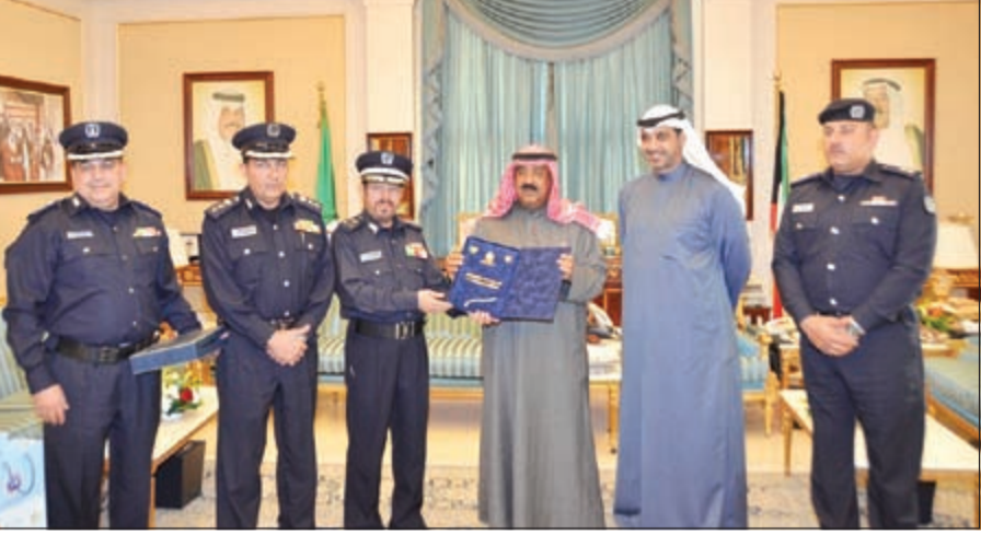
الشيخ مشعل الأحمد يتسلم درعاً تكريمية من الوفد