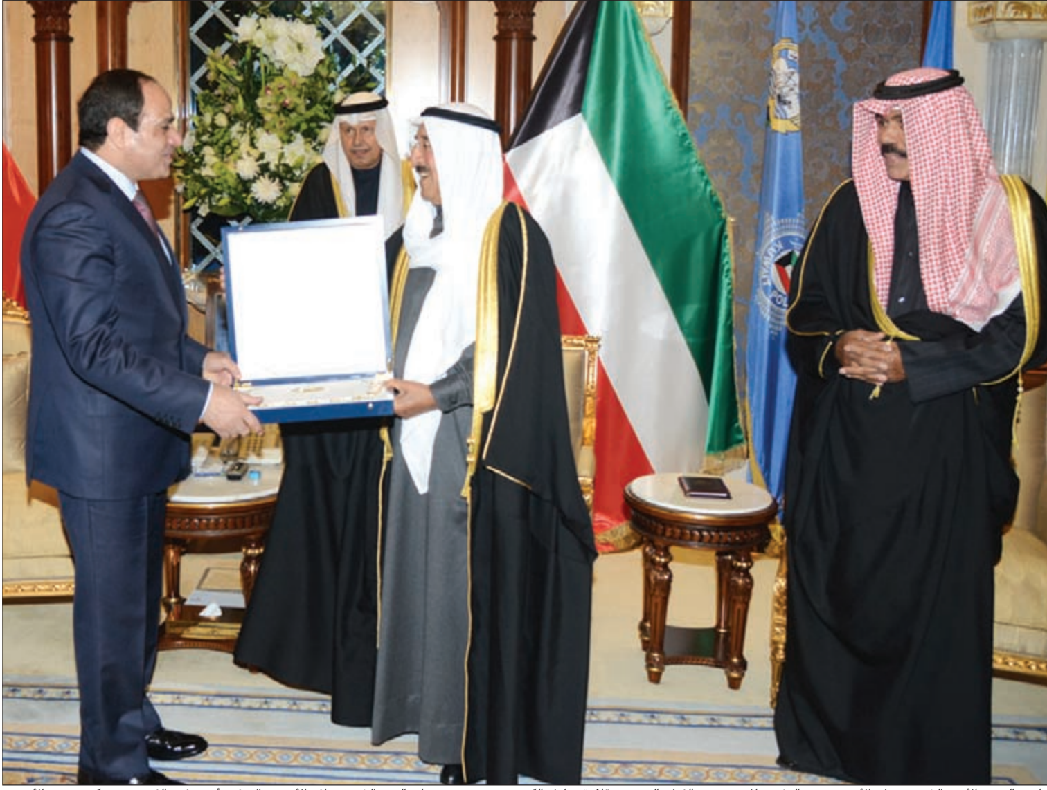
صاحب السمو الأمير الشيخ صباح الأحمد يهدي الرئيس المصري عبدالفتاح السيسي قلادة مبارك الكبير بحضور سمو ولي العهد الشيخ نواف الأحمد والسفير أحمد فهد الفهد مدير مكتب سمو الأمير