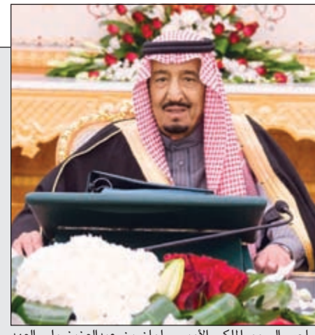
صاحب السمو الملكي الأمير سلمان بن عبدالعزيز ولي العهد نائب رئيس مجلس الوزراء وزير الدفاع