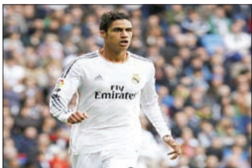
فاران والذهاب الى مسرح الاحلام

حدد نادي مان يونانيد اولوياته خلال الفترة المقبلة من تعاقدات لازمة من أجل تدعيم خط الدفاع في شهر يونيو المقبل.