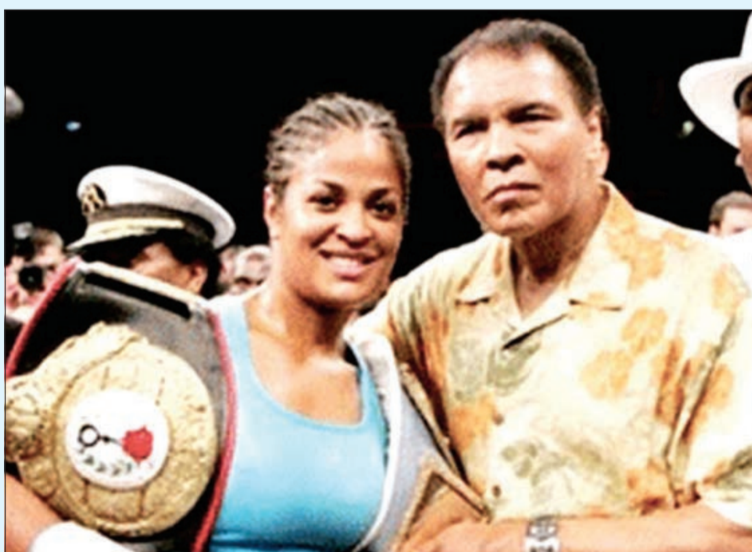
محمد علي وابنته ليلي

أكدت ليلي ابنة أسطورة الملاكمة الأمريكي، محمد علي كلاي، عبر الشبكات الاجتماعية، أن والدها تخلى الأزمة الصحية التي عانى منها، حيث احتجز الشهر الماضي بمستشفى لويسفيل بولاية كنتاكي عقب إصابته بالتهاب رئوي.