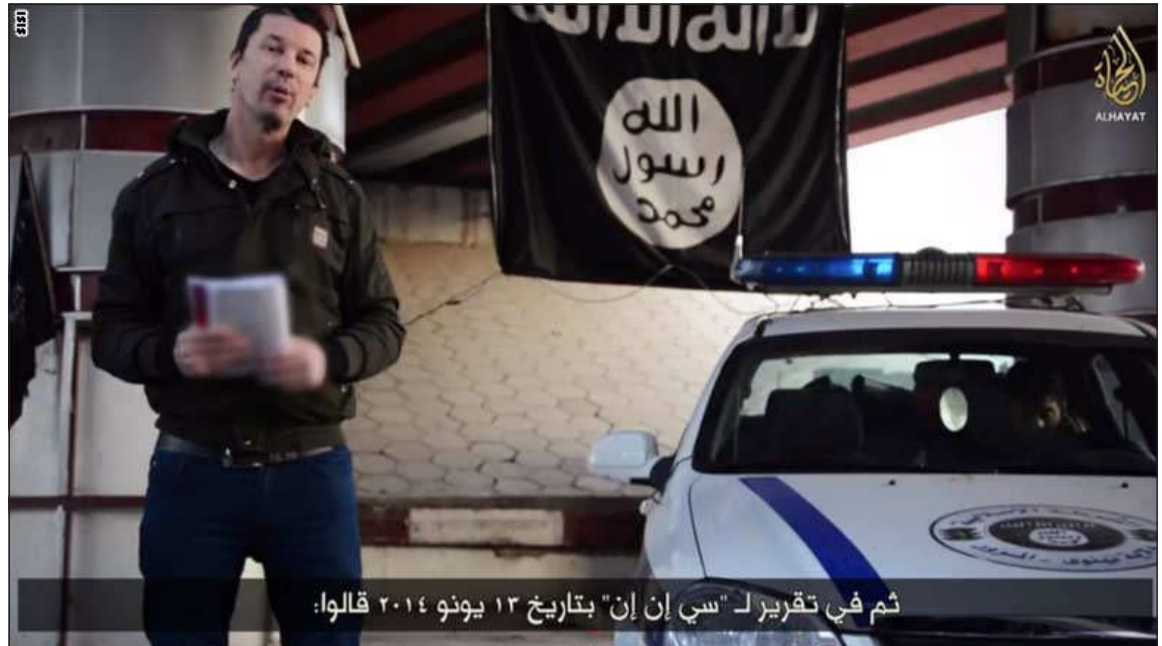
ثم في تقرير لـ «سي إن إن» بتاريخ ١٢ يونيو ٢٠١٤ قالوا:

الرهينة البريطاني كانتلي كما بدا في الفيديو