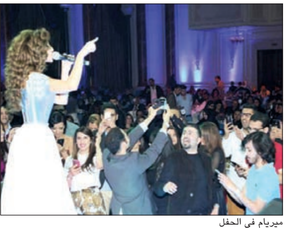
ميريام في الحفل

وجمع هذا الحفل، الذي اعتبر الأضخم والأهم لهذا العام في قطر، حشدا كبيرا من الساهرين الذين جاءوا من مختلف المناطق وحتى من بعض الدول العربية المجاورة. وبعد الاحتفال بحلول العام الجديد بحوالي 5 دقائق، دخلت فارس قاعة «الوجبة» على وقع أنغام أغنية «واحشني إيه» فارتفعت صيحات الساهرين الذين تغالغوا معها من اللحظة الأولى لاعتلائها المسرح، ولم يعكر صفو الحفل، حسب موقع «نواعم»، إلا منع الحراس الموزعين في أرجاء الصالة وعلى أطراف المسرح، الجمهور من الاقتراب من المكان لالتقاط الصور على طريقة «السيلفي»، وذلك على الرغم من وعد ميريام الجمهور بعدم مغادرة الحفل إلا بعد التقاط