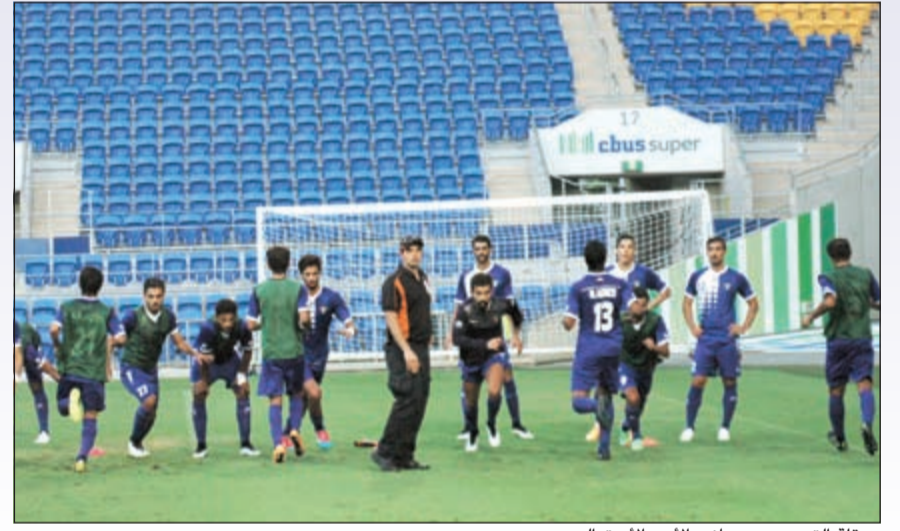
عرقة التدريب من جانب الأمن الأسترالي