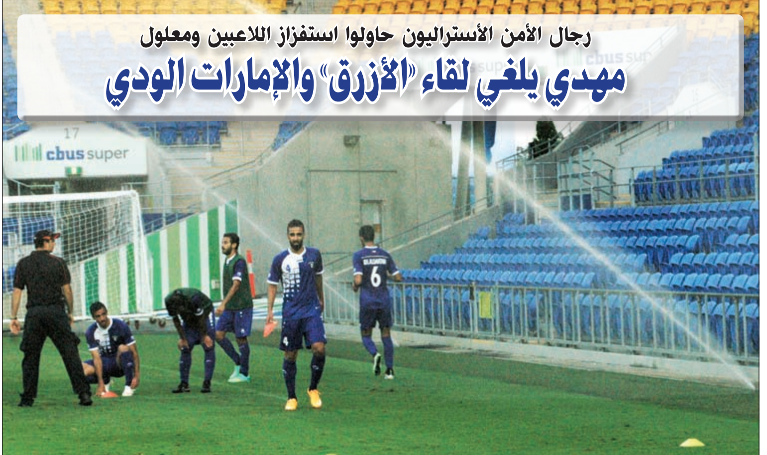
تشغيل مرشات الماء أثناء تدريب منتخبنا

في الاتحاد الإماراتي بإخراج الأزرق من الملعب حتى يستنى له ولفرقة التدريب وإجراء تقسيمة يديرها الحكام الأستراليين. وتمتدح المتعهد بشأن أصحاب رجال الأمن وطالبهم بإخلاء الملعب خلال 3 دقائق، ليتم اطفاء جزء من الإضاءة في استاد ليقترب رجال الأمن من اللاعبين خلال التدريب خارج الملعب في المنطقة الخاصة خلف المرمى بعد اخلاء الملعب الرئيسي، إلا أن ذلك لم يشف غليل المتعهد الأسترالي الذي يتلقى أوامره مباشرة من مهدي العلى، حيث طالب عمال الستاد بتشغيل مرشات الماء القريبة من منتخب الكويت، تلا ذلك ملاحقة أحد رجال الأمن اللاعبين وهم في طريقهم لمغادرة الستاد وكاد أن يحثك بالمدرّب نبيل معلول بعد محاولة استفزازية للاعبين والمدرب، وبعد ذلك بثوان قليلة دخل مهدي علي وفرقته للتدريب في الستاد.