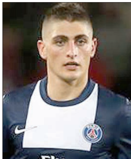
الإيطالي يرفض «البريميرليغ»

وجه نجم وسط باريس سان جرمان ماركو فيراتي صفعاً قوية إلى ثلاثي إنجلترا ليفربول ومان يونايتد وأرسنال وأكد بقاءه في العاصمة الفرنسية.