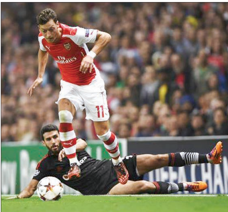
جماهير أرسنال بانتظارك

وأوضح أوزيل في ختام تصريحاته أن كل شيء من الممكن أن يتغير في «البريميرليغ»، وأن فرص أرسنال لا تزال قائمة لتحقيق الإنجاز، كما هو الحال بالنسبة لدوري أبطال أوروبا.