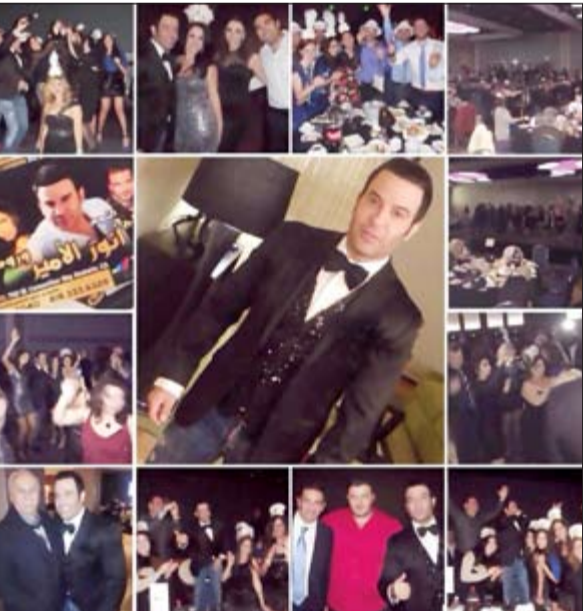
أنور الأمير يستقبل العام الجديد بطريقته الخاصة

بيروت - ندى مفرح سعيد توجه الفنان أنور الأمير من «ديترويت» مباشرة إلى «لوس أنجليس» ليلتقي بجمهوره ويستقبل معهم العام الجديد في حفل ساهم وسط حضور كبير من الجاليات اللبنانية والعربية احتفل النجم أنور الأمير بلبيلة رأس السنة، وقدم وصلة غنائية تجاوزت الـ 3 ساعات برغبة من الحضور، وكانت الأجواء كالعادة مميزة وممتعة مع الأمير، ورغم أنه مدد وقته ليرضي محبيه إلا أنه وعند انتهاء وصلته بدأ الحضور يردد «وبدنا الأمير» وخجلا منه قدم أغنيتين إضافيتين كي لا يرحل محببه. على صعيد آخر، يتوجه الأمير إلى «أورلندو» ليحيي سهرتين في 7 و9، وكان من المفترض العودة إلى بيروت لكن النجاح الذي حققه في أميركا ضمن جولته، جدد له 4 حفلات حيث سينتقل من «أورلندو» إلى «ديترويت» من ثم إلى «بوسطن» فيما بعد إلى «شيكاغو» ليختتم جولته في «لوس أنجليس».