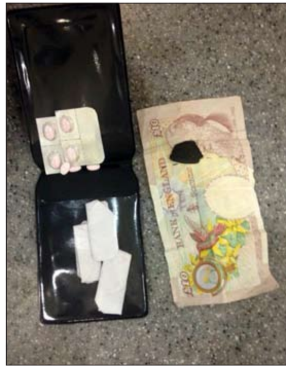
الكوكايين والحشيش والحبوب حاول وافد تهربها في حافظة النقود