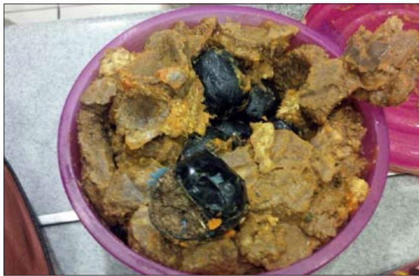
الماريغونا وقد أخفاها الوافد في شرائح لحم