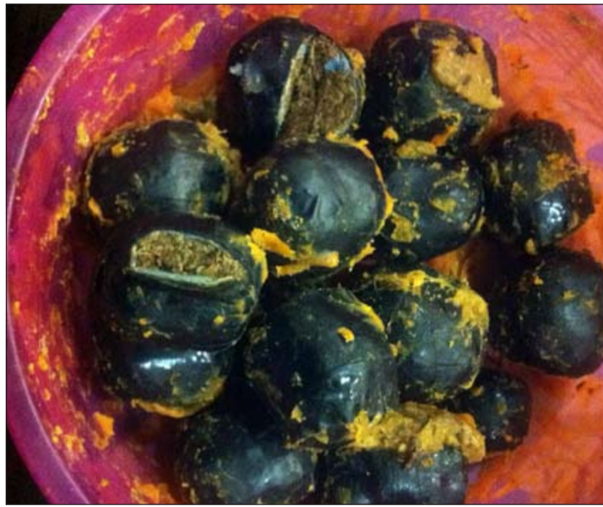
الماريغونا بعد التطهير والتنظيف