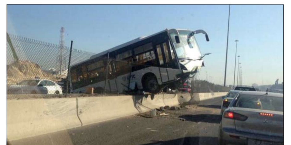
من الحادث الغريب

طريق الدائري السادس فتوجه على الفور رجال الأمن ورجال الإسعاف الى موقع البلاغ فبين ان الحادث لم يسفر عن وقوع إصابات، وأردف المصدر ان الحادث كان ان يتسبب في كارثة بعد ان اصطدم بالحاجز الأسمنتي بعد ان أقتلت مقود المركبة، حيث قام رجال الإطفاء بسحب القاطرة وفك الإزدحام الواقع.