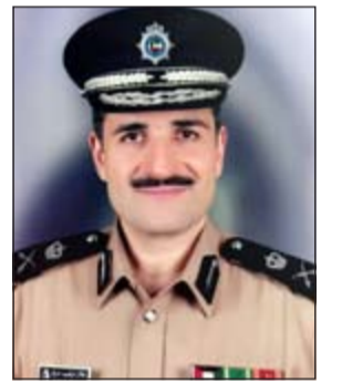
اللواء طلال معرفي