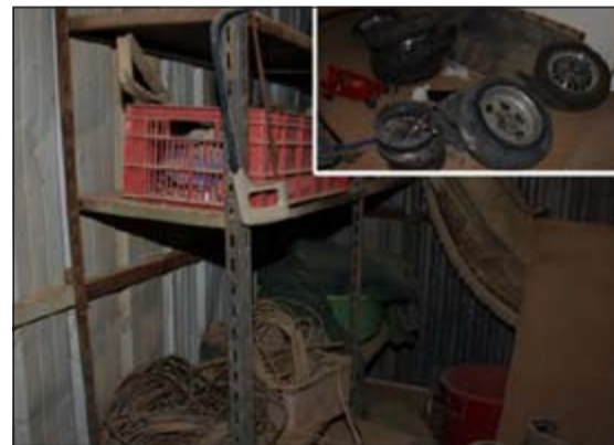
الجاكور تحول إلى كراج لبيع أغراض المستهترين

من ظاهرة سباقات الرعونة والتهور التي يلجأ إليها بعض الشباب من صغار السن ستتواصل وفي جميع المناطق لوقاية هؤلاء الشباب من الموت المحقق وما يخلفه سلوكهم المخالف للقانون من إصابات وعاهات مستديمة يصعب علاجها، مناشدة في الوقت ذاته كل أولياء أمور الشباب من آباء وأمهات وأقارب تحمل مسؤولياتهم ودورهم الرقابي تجاه أبنائهم كذلك المجتمع ومؤسساته وأفراده لمساندة جهود وزارة الداخلية وأجهزة الأمن وقف مسلسل الحوادث المؤسفة التي يروح ضحيتها الأبرياء جراء هذه السباقات القاتلة والعمل على إيجاد المنتفس والبدائل كي يمارس هؤلاء الشباب هواياتهم وقضاء أوقات فراغهم واستثمار طاقتهم بما يعود عليهم بالنفع حفاظا على أرواحهم البديلة.