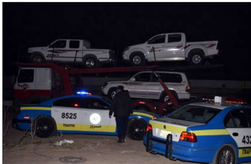
الحملة جاءت بمشاركة المباحث الجنائية وقطاع المرور

كاد باص ان يتسبب في حادث مروع على طريق الدائري السادس بعد ان اصطدم بالحاجز الأسمنتي المقابل لستاد جابر وتعامل مع الحادث رجال الإطفاء، وقال مصدر أمني ان بلاغا ورد صباح امس عن وقوع حادث اصطدام على