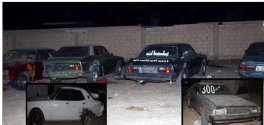
من داخل الجاكور رصدت مركبات عليها عيارات غريبة وطريفة