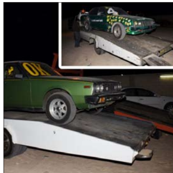
المركبات المضبوطة داخل الكراج إلى كراج الحجز