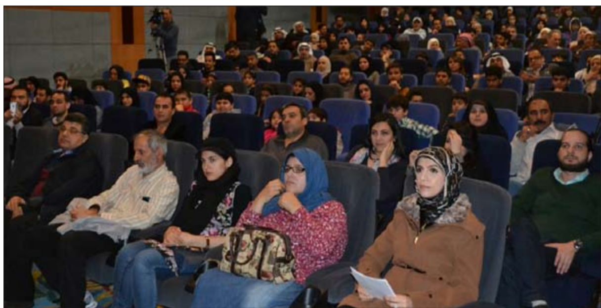
جانبا من الحضور الجماهيري الكبير لانشطة المهرجان

أهم أسباب نجاح التجربة السينمائية الإيرانية إفلاتها من شركاء السينما الغربية ومعالجتها لمهوم المجتمع بأسلوب تربوي وعلمي بعيداً عن الجنس والإغراء والعنف الذي اشتهرت به سينما هوليوود