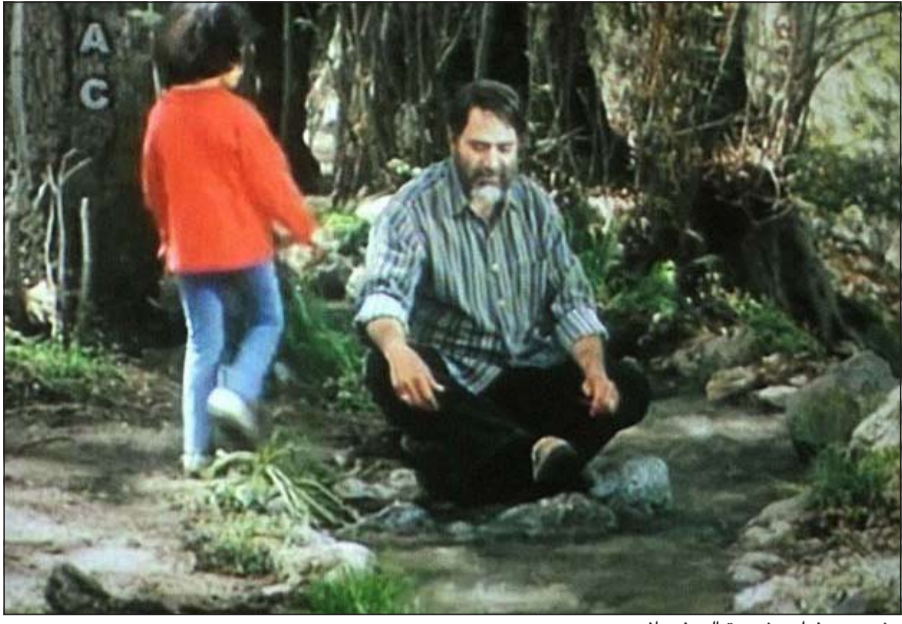
مشهد من فيلم «شجرة الصفصاف»