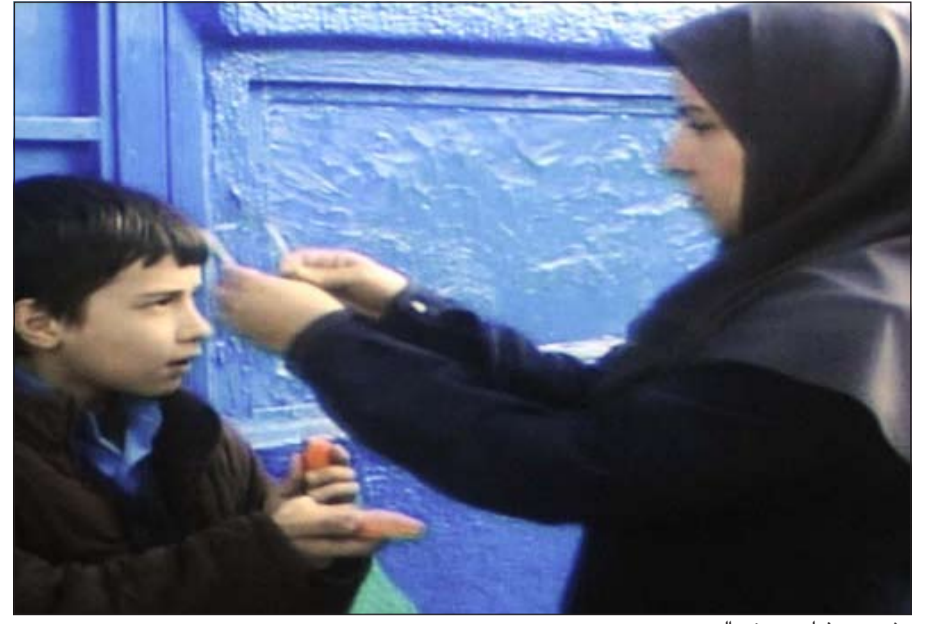
مشهد من فيلم «حوض الرسم»