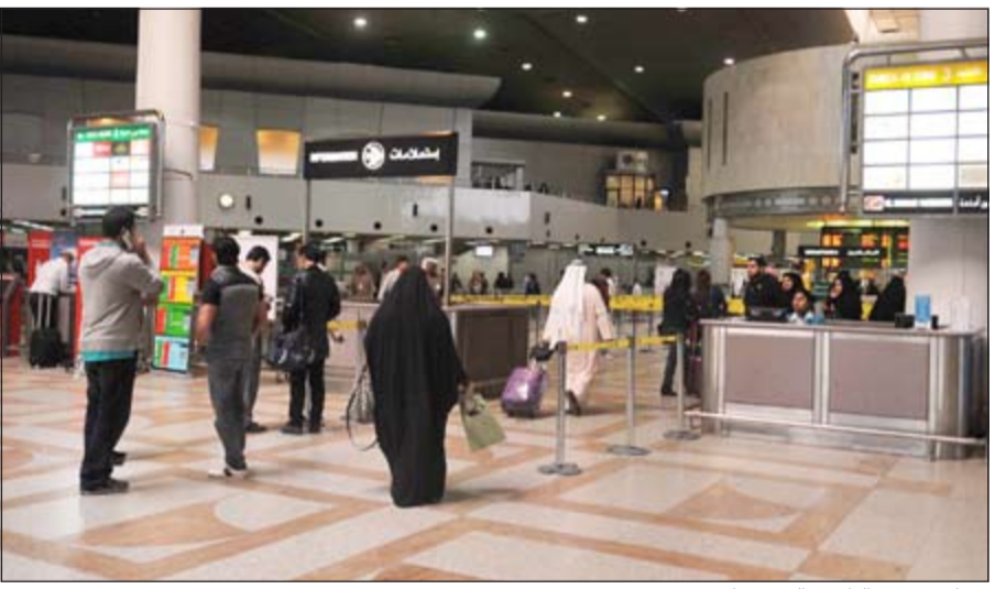
مسافرون في الطريق إلى وجهاتهم