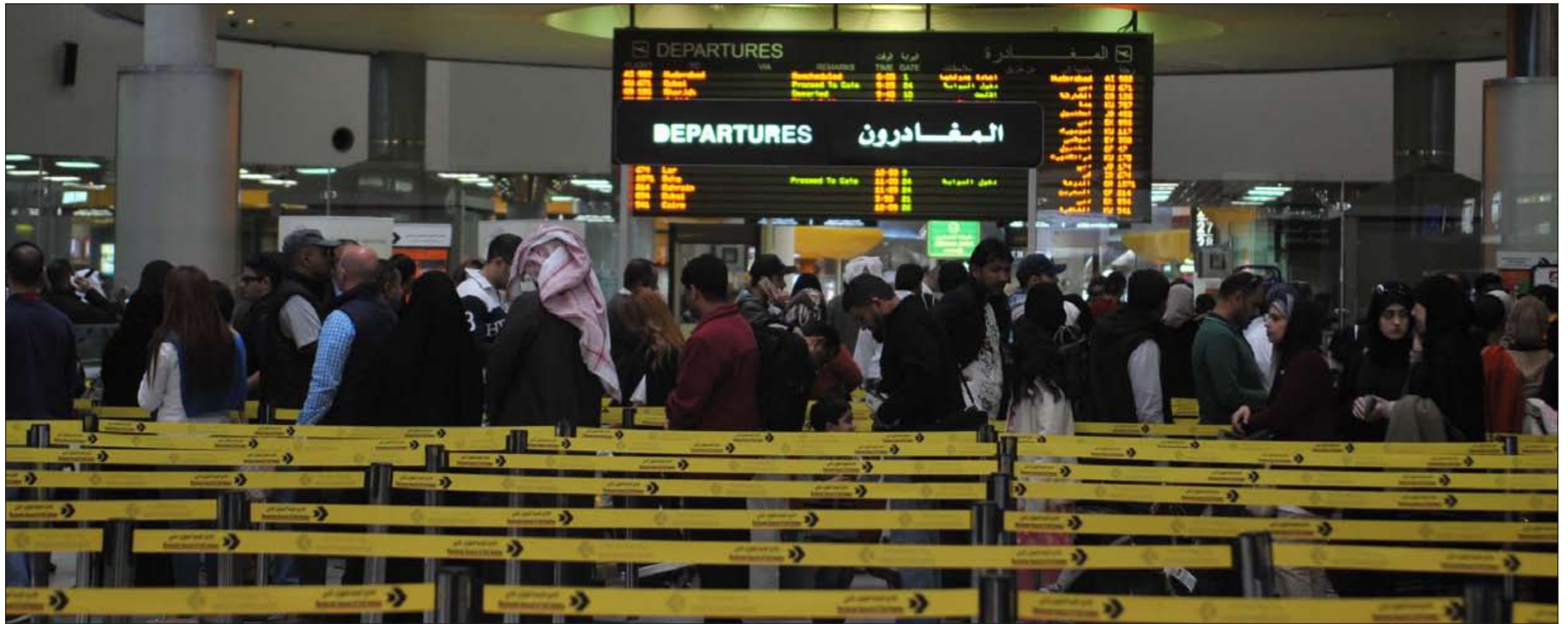
ارتفاع أسعار التذاكر والامتحانات خففا من الازدحام داخل المطار