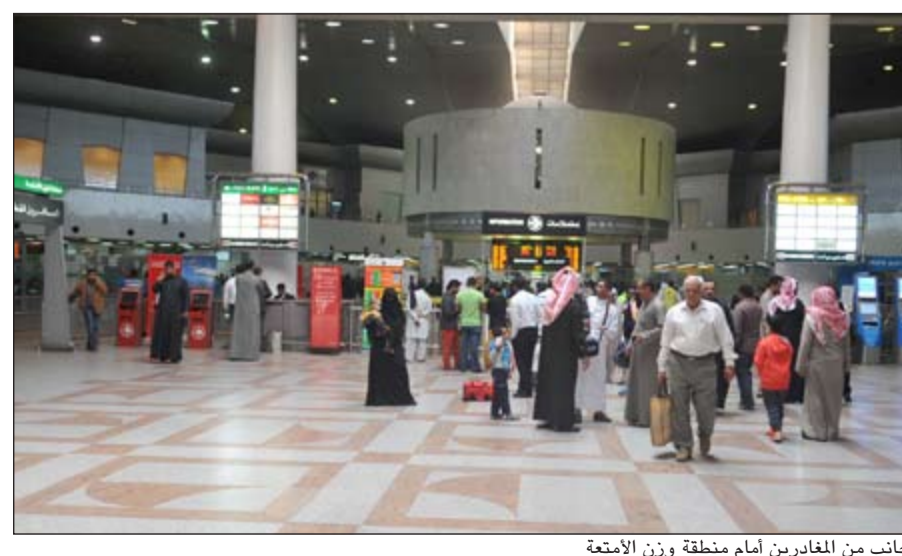
جانب من المغادرين أمام منطقة وزن الأمتعة