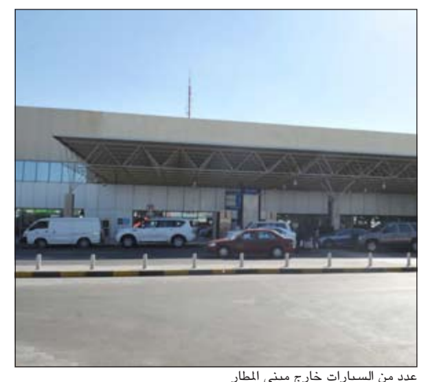
عدد من السيارات خارج مبنى المطار