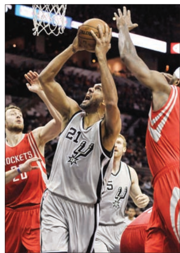
دانكن ومساهمة كبيرة في فوز سان أنتونيو

وقد ساهم تيم دانكن والإرجنتيني مانو جينوبلي وكوري جوزف في هذا الفوز ايضا بعد ان سجل الاول 16 نقطة مع 8 متابعيات والثاني 15 نقطة مع 5 متابعيات و4 تمريرات حاسمة والثالث 14 نقطة مع 6 متابعيات و4 تمريرات حاسمة. وعلى ملعب «بيبيسي سنتر»، لم يجد تورونتو رابسونز صعوبة تذكر في تعزيز صدارته للمنطقة الشرقية وتحقيق فوزه السابع في مبارياته الثماني الاخيرة والرابع والعشرين في 31 مباراة بتغلبه على