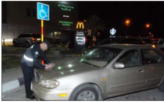
تحرير المخالفات للحد من استخدام مواقف المعاقين من قبل الأوصاف

وأكد اللواء المهنا أن هناك تنسيقاً وتعاوناً كاملاً بين الإدارة العامة للمرور وإدارة الإعلام الأمني في مجال التوعية بحقوق ذوي الاحتياجات الخاصة وضرورة