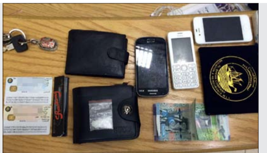
المضبوطات احيلت إلى المكافحة