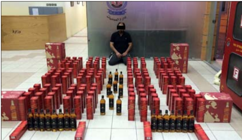
المواطن وامامه المضبوطات

الاحمدى وبعد التأكد من صحة وجدية تلك المعلومات حيث تم تشكيل فرقة أمنية واتخاذ الإجراءات القانونية اللازمة لضبط هذا المروج، وبمداومة مسكنه وتفقيش المسكن والمركبة تم العثور على 180 زجاجة خمر وبمواجهته بما تم ضبطه وما بحوزته وما لدى رجال الأمن من تحريات افاد بان المواد التي تم ضبطها تخصه وأنه يقوم بالتجار في الخمور المستوردة. وتم إحالة المتهم والمضبوطات الى جهات الاختصاص لاتخاذ الإجراءات القانونية اللازمة.