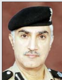
لواء ابراهيم الطراح

1991 ويعمل بوزارة الداخلية برتبة شرطي، والآخر شاب كويتي الجنسية مواليد 1992 يعمل بوزارة الدفاع، وذلك عند تجوال الدورية تمت مشاهدة وانبت اخضر مستهتر وعند الطلب منه الوقوف لان بالفرار وعند متابعة الشخص الى منطقة الظهر قام بالاستهتار وتم الاصطدام بالدورية وتمت مقاومة رجال الأمن للهروب وعند السيطرة عليهما تبين