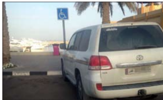
الواجهة البحرية لم تسلم من مخالفات الامن العام