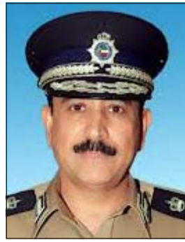
لواء عبدالله المهنا

احترام المواقف المخصصة لحجز (92) مركبة لذات السبب خلال نفس الفترة. كما تم تسجيل 955 مخالفة لاستخدام الهاتف النقال باليد أثناء القيادة، وتسجيل عدم الانتباه أثناء القيادة مع نفس المخالفة. وبين اللواء المهنا أن الإدارة العامة للمرور تقوم بحصر وتحديد المواقف العامة التي تضم مواقع لمواقف المعاقين ولتشديد الرقابة على مخالفة وقوف غير المعاقين بها تقديراً لظروف هذه الفئة مع الاستمرار في متابعة هذه المواقف