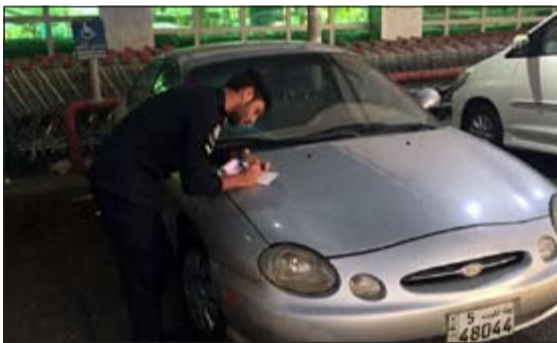
.. والأسواق أيضا