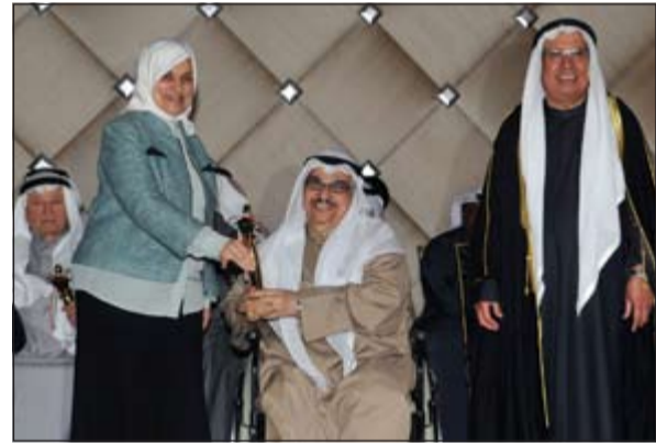
تكريم احدي الفائزين