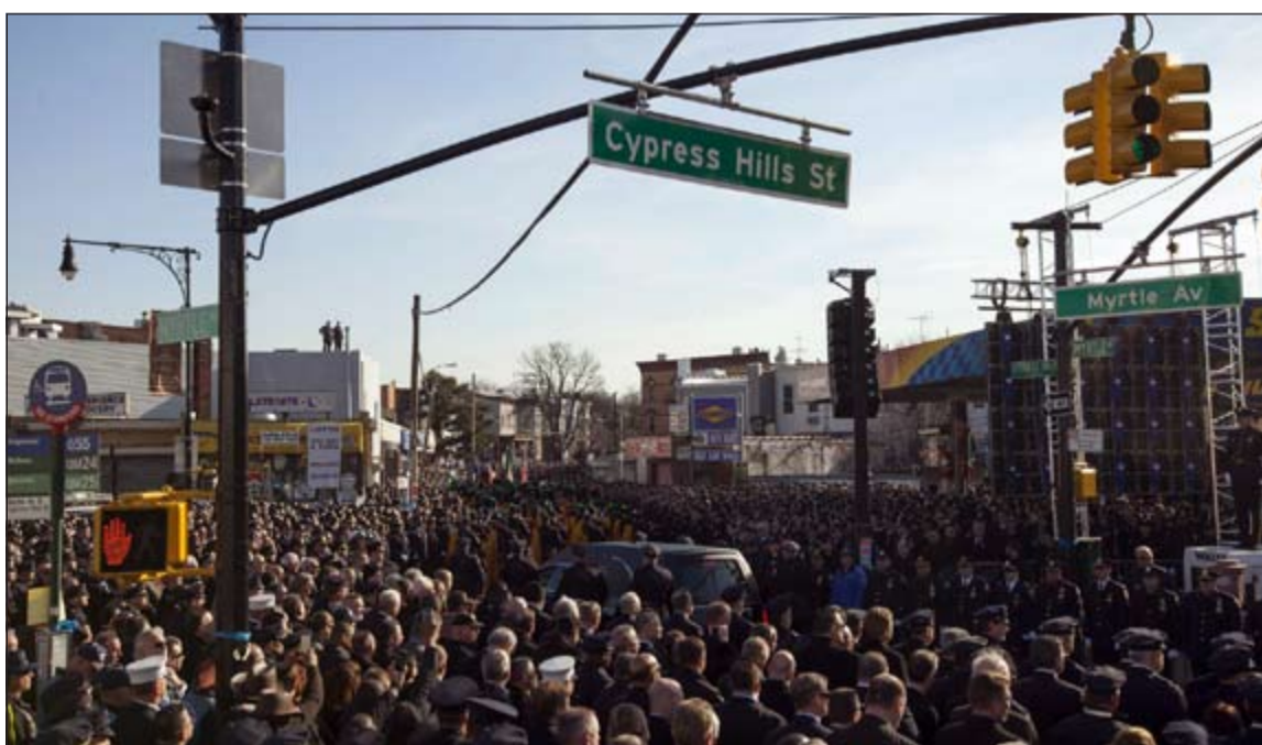
الآلاف يشيعون جثمان الشرطي القتيل في نيويورك أمس الأول

نيويورك والشوارع المجاورة لها في أمس لتشيع جثمان أحد ضابطي الشرطة الذين قتلها مسلح قال إنه ينتقم لقتل رجال سود عزل بأيدي رجال شرطة من البيض. ونظمت مظاهرات عديدة في أنحاء الولايات المتحدة منذ قررت هيئات محلية كبرى عدم توجيه اتهامات إلى شرطي فيما يتعلق بقتل رجلين سودين أعززين في فيرجسون بميزوري ونيويورك سيتي.