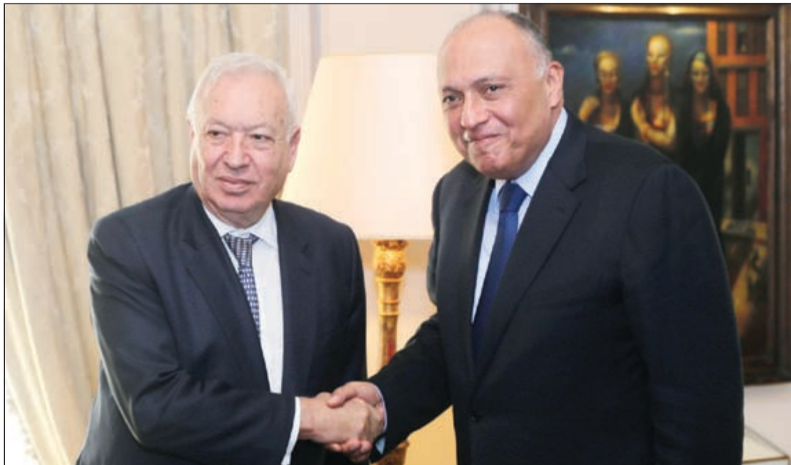
وزير الخارجية المصري سامح شكري يصافح نظيره الإسباني خوسيه مانويل غارسيا خلال لقائهما في القاهرة أمس

واعتبر رئيس الوزراء الإسرائيلي أن مثل تلك التصريحات تؤدي في نهاية الأمر إلى «ارتكاب العمليات الإرهابية التي شهدناها مؤخرا»، في إشارة إلى العمليات الفلسطينية في القدس والضفة الغربية. كما تساءل عن دور الأمم المتحدة إزاء تلك التصريحات، وقال مستنكرا: «بدلا من التعامل بشدة مع هذا الترخيص، الأمم المتحدة تقوم بدعم مشروع قرار فلسطيني أحادي عبارة عن محاولة لتهمير قرار في مجلس الأمن، يهدف إلى طرح تسوية ستفرض علينا وتؤدي إلى الأرض الليبية».