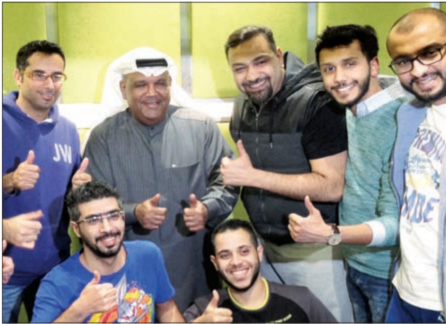
ويتوسط فريق عمل البرنامج