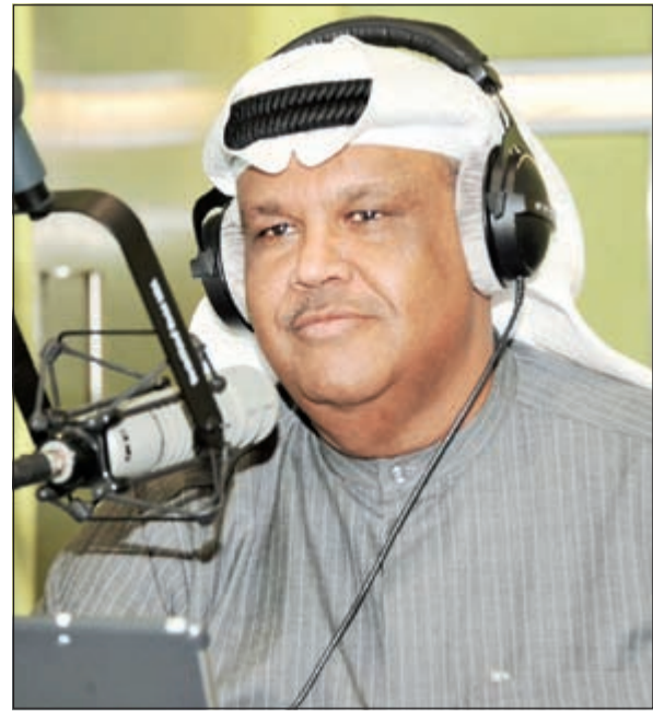
نبيل شعيل أثناء استضافته في «دايركت»