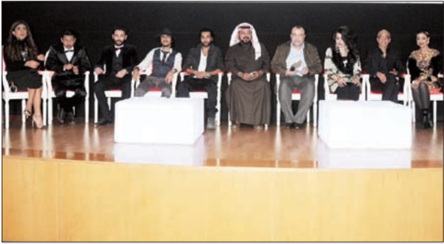
جانب من المؤتمر الصحافي

جميل أن نجد مؤسسات فنية كويتية وبجهد ذاتي تسعى لتقديم أعمال سينمائية تناقش عدداً من القضايا الاجتماعية التي تمر في مجتمعنا، وجميل أن نجد ممثلين شباباً يسعون للمشاركة في أعمال سينمائية تثبت نجوميتهم التلفزيونية ولكن الأجل أن