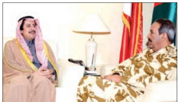
الشيخ خليفة بن أحمد آل خليفة خلال لقائه السفير الشيخ عزام الصباح

وأكد الشيخ خليفة خلال لقائه عميد السلك الدبلوماسي سفيرنا لدى مملكة البحرين الشيخ عزام الصباح أهمية وحدة الصف الخليجي، مشدداً على أهمية التنسيق العسكري بين دول مجلس التعاون. وتطرق اللقاء كذلك إلى العلاقات الثنائية بين البلدين، حيث أشاد الشيخ خليفة بعمق وتطور العلاقات «الأخوية» بين مملكة البحرين والكويت، من جانبها،