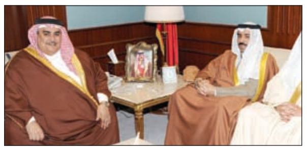
الشيخ خالد بن أحمد بن محمد آل خليفة مستقبلاً د.عبدالعزیز السبيعي

جاء ذلك على هامش الزيارة التي قام بها رئيس المنظمة