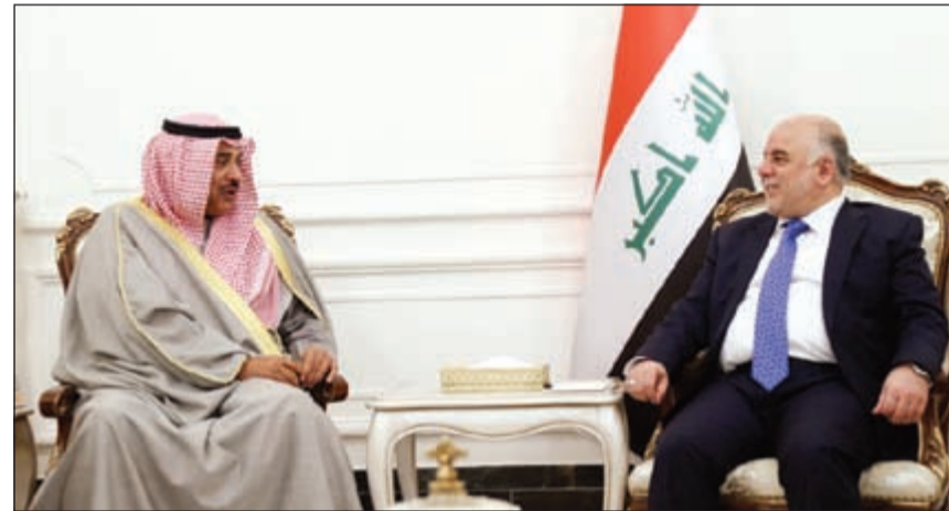
الخالء أثناء لقائه رئيس الوزراء العراقي حيدر العبادي