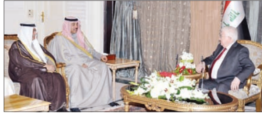
الشيخ صباح الخالد خلال لقائه الرئيس العراقي فؤاد معصوم