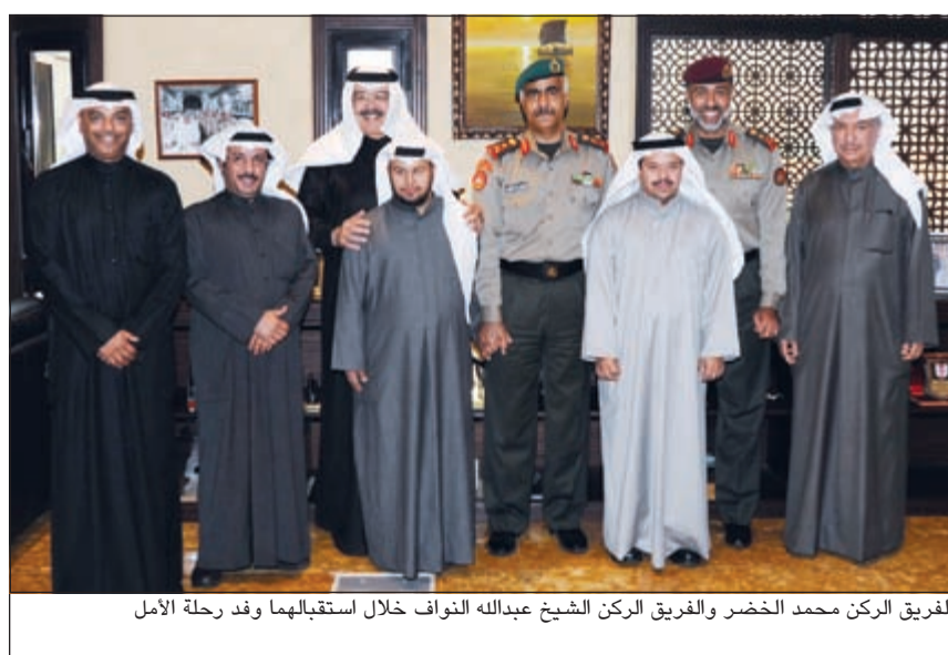
الفريق الركن محمد الخضر والفريق الركن الشيخ عبدالله النواف خلال استقبالهما وفد رحلة الأمل

وأوضح انه التقى اليوم على هامش زيارته الرئيس العراقي فؤاد معصوم ورئيس مجلس الوزراء حيدر العبادي وبحث معهما العلاقات الثنائية بين البلدين وما أحرزته من تقدم كبير.