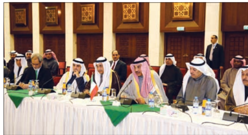
.. ومترشداً وفد الكويت في اعمال الدورة الرابعة للجنة العليا المشتركة بين الكويت والعراق

ان اللجنة المشتركة ناقشت ملف الصيادين ودعا الجانب الكويتي الى توسيع التعاون في مجال الصيد البحري. وقال ان البلدين يتطلعان الى تعزيز التعاون ليس في مجال الاستثمار فحسب بل في قطاعات الرياضة والفنون والتعليم.