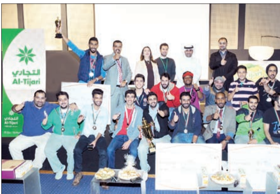
الفائزون مع مسؤولي البنك التجاري

ويستطيع أصحاب حساب @Tijari للشباب الحصول على خصومات حصرية لدى العديد من محلات الملابس والمطاعم والنوادي الرياضية، بل يمكنهم المشاركة في العديد من الأنشطة والفعاليات المتميزة التي ينظمها البنك كل عام، هذا بالإضافة إلى حصول طلبة الكليات والجامعات الذين يقومون بتحويل علاوتهم الاجتماعية إلى البنك التجاري على 50 دينارا يتم إيداعها في حساباتهم كهدية ترحيب من البنك بانضمامهم إلى هذا الحساب.