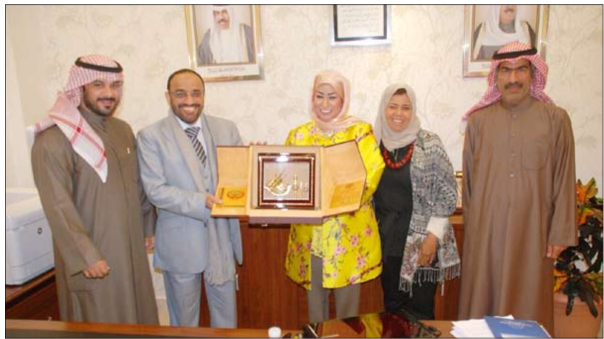
تكريم مستشفى الأمراض السارية