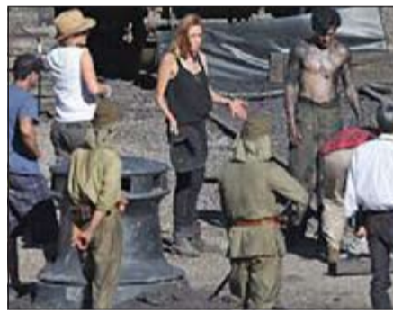
جولي في موقع التصوير أثناء أحد المشاهد

نيويورك - سي ان ان حقق فيلم «Unbroken»، الذي أخرجه النجمة أنجلينا جولي حقق أرباحاً أكثر مما كان متوقفاً في اليوم الأول لعرضه في الولايات المتحدة الأميركية ليلة عيد الميلاد المجيد. وكان من المتوقع أن يحقق الفيلم الذي يعرض في 3131 من دور العرض أرباحاً تصل إلى 30 مليون دولار خلال الـ 4 أيام من عطلة الميلاد، ولكن يبدو أن الأرباح ستتخطى ذلك. أما الفيلم الثاني المنافس فهو «Into the Woods» الذي من المتوقع أن يحقق أرباحاً تصل إلى 10 ملايين دولار في يوم الميلاد، ومن المتوقع أيضاً أن تتخطى أرباحه الـ 30 مليوناً في 4 أيام.