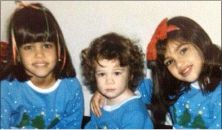
كارديشيان الطفلة مع شقيقتها

مرة، حيث استطاعت عدسات المصورين، تصوير لحظات مهمة ومؤثرة، تنهمر فيها دموع الآباء بصدق وقت رؤية بناتهم الصغار، كبرن وأصبحن على أعتاب بداية جديدة و حياة مختلفة. وقد جمعت الصور العديد من ردود أفعال الآباء، حيث يشعر الآباء في هذا اليوم المهم واللحظة المميزة، بالعديد من المشاعر المتناقضة بين الحزن والفرح، فبعضهم يندم عند رؤية فئاته الصغيرة يوم زفافها والبعض الآخر يحتضن ابنته وفرح وسعادة شديدة، بينما لا يمكن للبعض الآخر حس دموعه، خاصة وهو اليوم الأخير الذي سيرى الأب فيه بنته يومياً ويجلس معها كالمعتاد. الأب هو الحب الأول لابنته، وسنذنها في الحياة، فالأب هو الأمان والحماية بالنسبة لابنته، والقوة الحسنة لولادته، حيث يفني عمره بالكامل في إرضاء ابنائه، وتأمين مستقبلهم، والعمل على توفير راحتهم. الزفاف هو اليوم الذي تنتظره الفتاة طوال حياتها، لتتزوج من فارس أحلامها وترتدي الفستان الأبيض الذي تحلم به طوال حياتها، وتتخلله طوال عمرها، وتبحث دائماً عن أجدد وأحدث الفساتين. وحسب ما نشرته «اليوم السابع» فقد عرض الموقع الكندي Dibly جانبا آخر لا يشاهده الكثيرون في حفلات الزواج، وهو رد فعل الآباء، عند رؤية بناتهم بالفستان الأبيض لأول