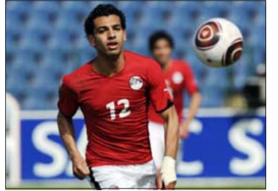
محمد صلاح مرشح للانتقال الى انتر ميلان أو بيشكاش

أشاد المدير الفني لفريق انتر ميلان الإيطالي روبرتو مانشيني بالنجم المصري محمد صلاح المحترف في تشلسي الإنجليزي، مؤكداً أنه لاعب صغير ومميز. جاء ذلك في الوقت الذي أشارت فيه تقارير صحافية إيطالية إلى قرب انضمام صلاح لصفوف إنتر. وعلى الرغم من تأكيدات المدير الفني لـ «البلوز» جوزيه مورينيو أن صلاح لن يغادر قلعة «ستامفورد بريدج»، إلا أن التقارير مازالت تؤكد أن رحيل صلاح أصبح مجرد مسألة وقت. وكان رئيس نادي بيشكاش التركي قد أكد في وقت سابق اهتمامه بصلاح، مؤكداً أنه يسعى للتعاقد معه في فترة الانتقالات الشتوية المقبلة.