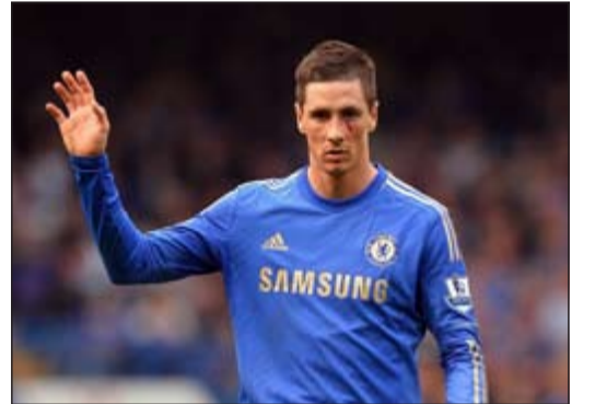
فرناندو توريس يبحث عن بريجه المفقود

أفادت تقارير صحافية إسبانية بأنه من المتوقع الإعلان رسمياً عن عودة الإسباني فرناندو توريس من ميلان الإيطالي إلى أتلتيكو مدريد الإسباني في أوائل يناير المقبل.