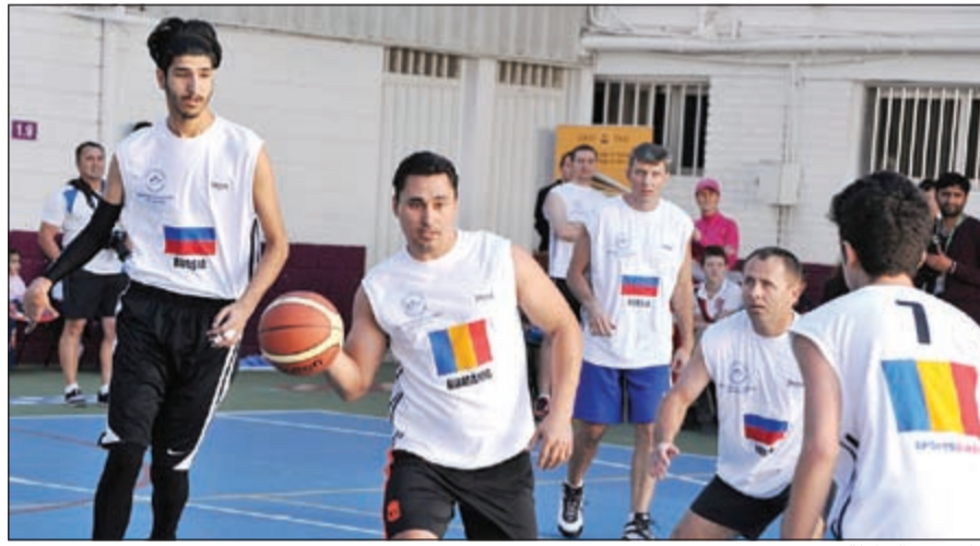
جانب من البطولة

البريطانية للرياضة بتنظيم مثل هذه الأحداث ذات المستوى الرفيع وبدعوة جميع السفارات للمشاركة في فبراير ببطولة الكرة الطائرة وفي ديسمبر ببطولة كرة السلة سنوياً.