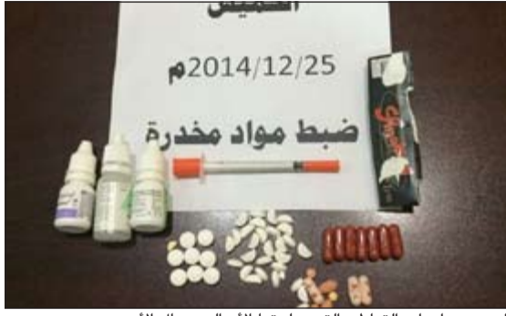
الحبوب وأدوات التعاطي التي سلمتها الأم إلى رجال الأمن