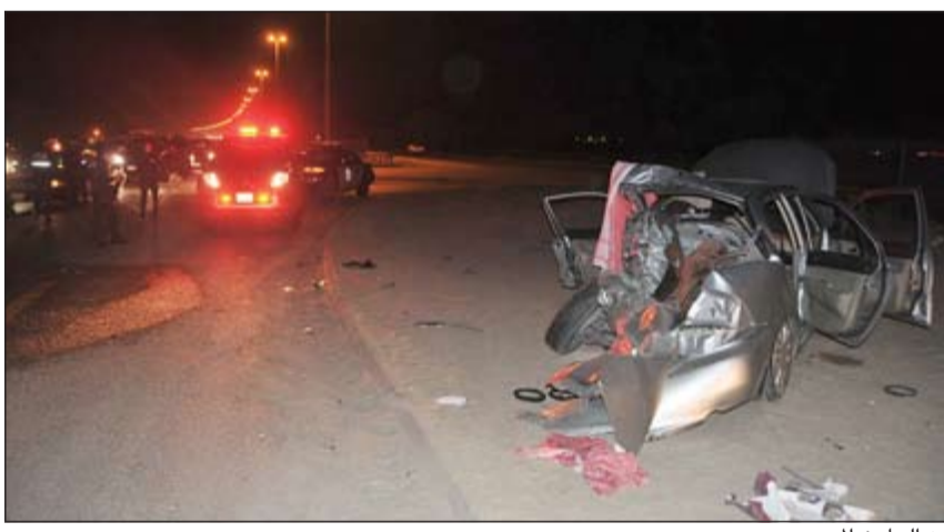
من الحادث المروع