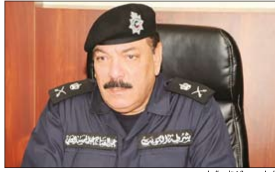
اللواء عبدالفتاح العلي