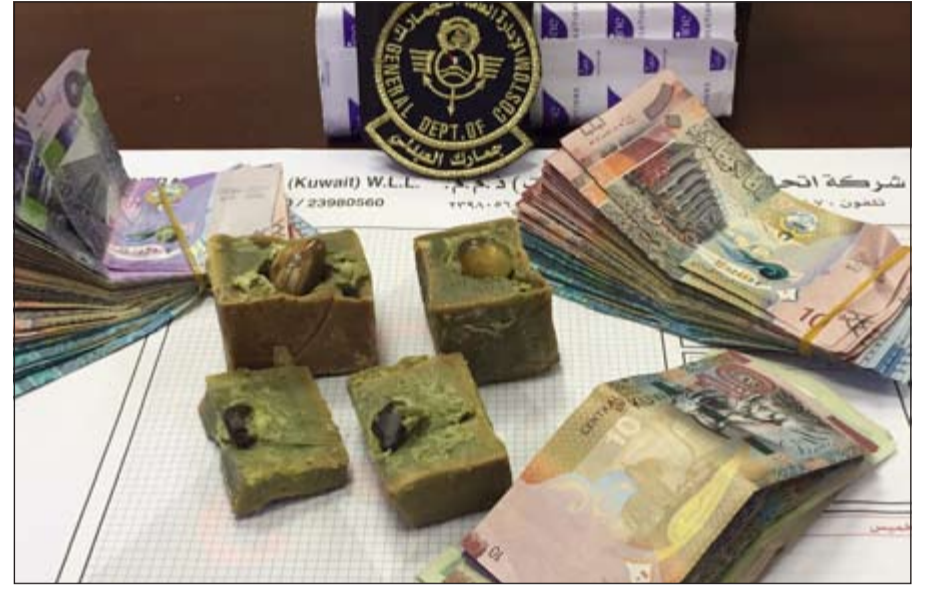
المضبوطات أحيلت إلى الاختصاص