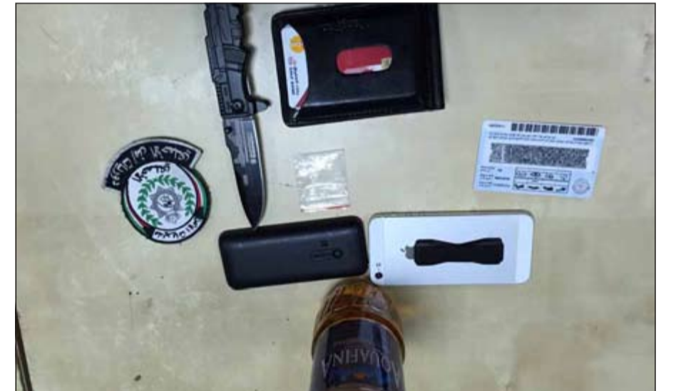
المضبوطات أحيلت إلى «المكافحة»