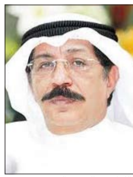
اللواء عبدالحميد العوضي

النيابة العامة وإغلاق 5 قضايا كانت مسجلة ضد مجهول، وبحسب مصدر أمني فإن تعدد قضايا السلب بانتحال صفة رجال الأمن محل اهتمام من قبل وكيل وزارة الداخلية