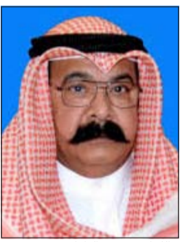
اللواء محمود الطباخ

المساعد لشؤون الأمن الجنائي اللواء عبدالحميد العوضي ومدير عام الإدارة العامة للمباحث الجنائية اللواء محمود الطباخ، حيث وضعت القضايا المسجلة ضد مجهولين على طاولة مباحث مبارك الكبير وتحديدًا أمام الملازم أول أيوب البلوشي والملازم مبارك القبيدي. وخلال مهمة البحث في القضايا المسجلة ضد مجهول تم التوصل إلى معلومات عن تورط بدون من المقيمين في منطقة المنقف في قضايا سلب، حيث تم عمل المزيد من التحريات والتي أكدت أن البدون من متعاطي المواد المخدرة والمسكرة، وأنه متورط