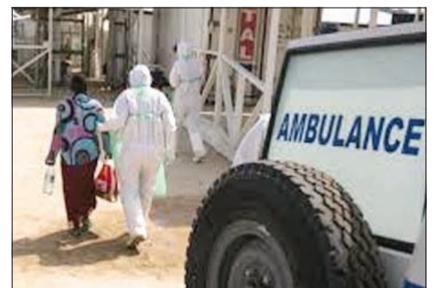
إيبولا يجتاح سيراليون

وسبق للحكومة أن فرضت هذا التدبير الوقائي الصارم على كل السكان بين 17 و 19 سبتمبر الماضي، أي لثلاثة أيام، قام خلالها أكثر من 28 ألف متطوع بحملة من بيت إلى آخر.