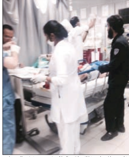
الخليجي المصاب خلال تلقيه العلاج في مستشفى الجهراء

وأظهرت صور ولقطات تلفزيونية عددا كبيرا من المارة وهم يسارعون إلى المكان لنيل نصيبهم من الدولارات، ووصل رجال شرطة، بعضهم كان مسلحا ويرتدي سترات واقية من الرصاص وخوذات على عجل إلى المكان لتأمين المنطقة التي انتشرت فيها أوراق مالمية قيمتها مليون و960 ألف دولار، إلا أن بعضا منها النقطه المارة والسائقون، وغير معروف حجمه تماما، فيما تمكنت الشرطة من استعادة معظم المبلغ المتناثر، وبعض ما جمعه المارة بعد أن