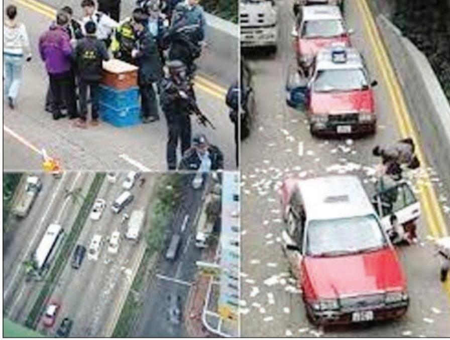
أربع صور تبين سقوط الدولارات على هونغ كونغ