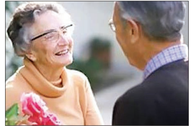
«سكانيا» في السويد أكثر بلدة تضم المعمرين

السويد - أ.ش.: تضم بلدة صغيرة تقع في جنوب السويد أكبر عدد من المعمرين فوق 100 عام بما يفوق متوسط