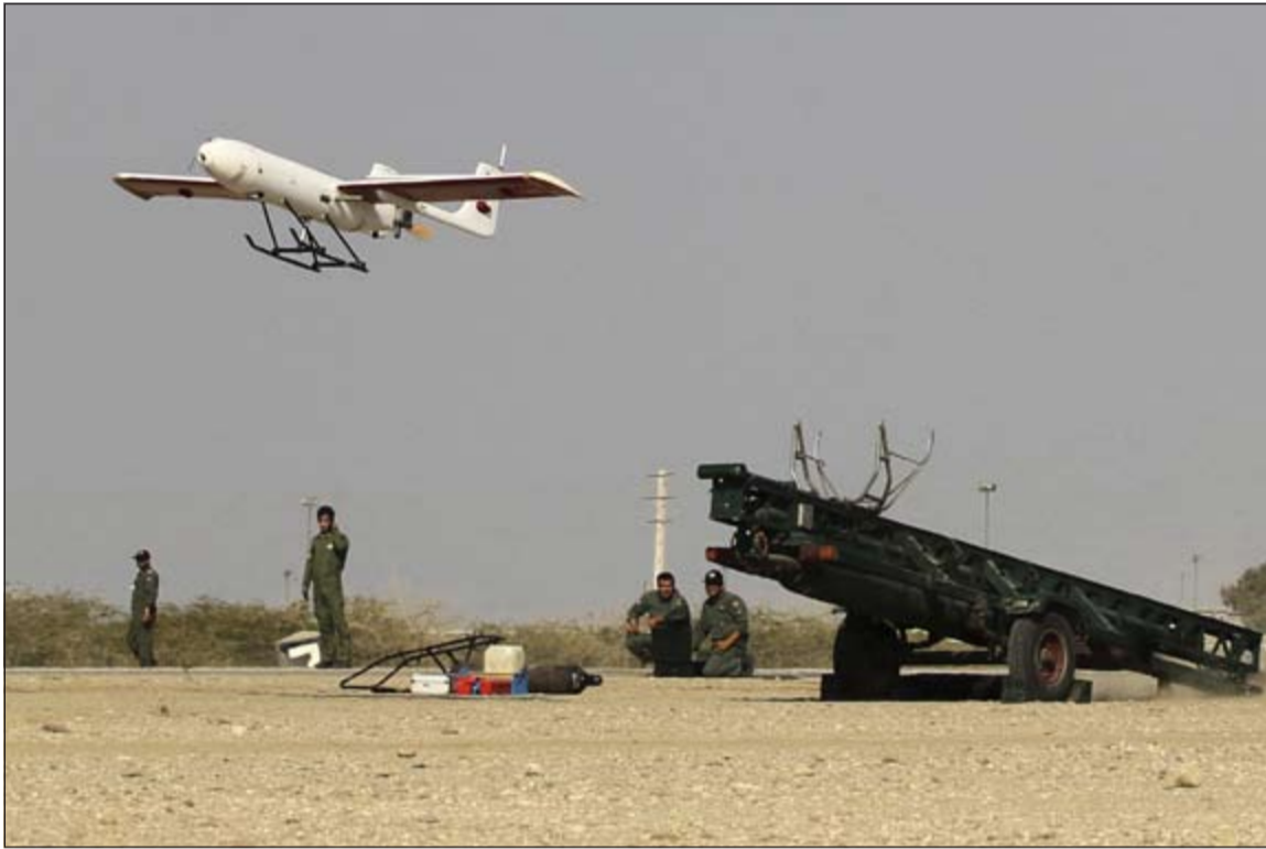
صورة نشرها موقع «مجموع» الإلكتروني الإيراني لطائرة استطلاع قال إنها صناعة إيرانية خلال المناورات امس (أ.ف.ب)

وأيضا بورديستان أنه سيجري في المناورة اختبار أسلحة مضادة للدروع منها صواريخ دهلاوية وتوفان، مضيفا أن صاروخ توفان هو سلاح دقيق بمدى 4 كيلومترات ويطلق من البحر ومن المروحيات، واستطرد قائلا إن أحد البرامج الأخرى في هذه المناورة هو تنفيذ عمليات الإفراج عن الرهائن بسببنايو يفترض أن موظفا في الدولة قد اختطف على أيدي إرهابيين وسيعبرون به الحدود إلى الخارج، وهنا تنتقل وحدة من القوات الإيرانية الخاصة بطائرة