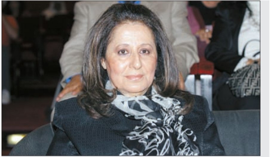
الكاتبة القديرة عواطف البدر