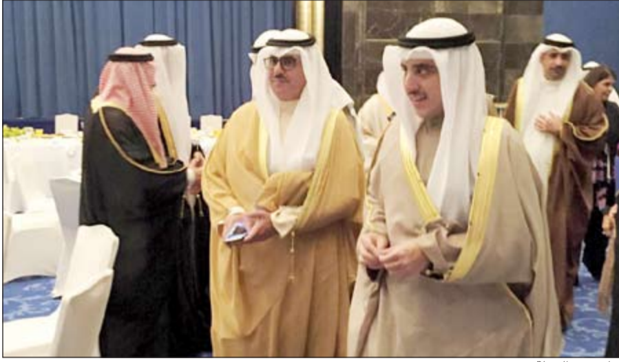
جانب من الجولة

وختاماً، أبدى الشيخ فهد سعادته وفرحه بتلك الحفاوة والاستقبال وحسن الضيافة التي شهدها الوفد الكويتي في دولة الإمارات العربية المتحدة ومملكة البحرين، وقال: هذه الضيافة تبرهن على أن دولنا الخليجية هي دولة واحدة وأرض واحدة وكلنا أخوة حكاما وشعبا.