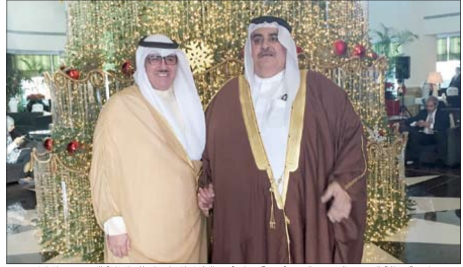
وزير خارجية مملكة البحرين الشيخ خالد بن أحمد آل خليفة مع الوكيل المساعد لقطاع الإذاعة الشيخ فهد المبارك