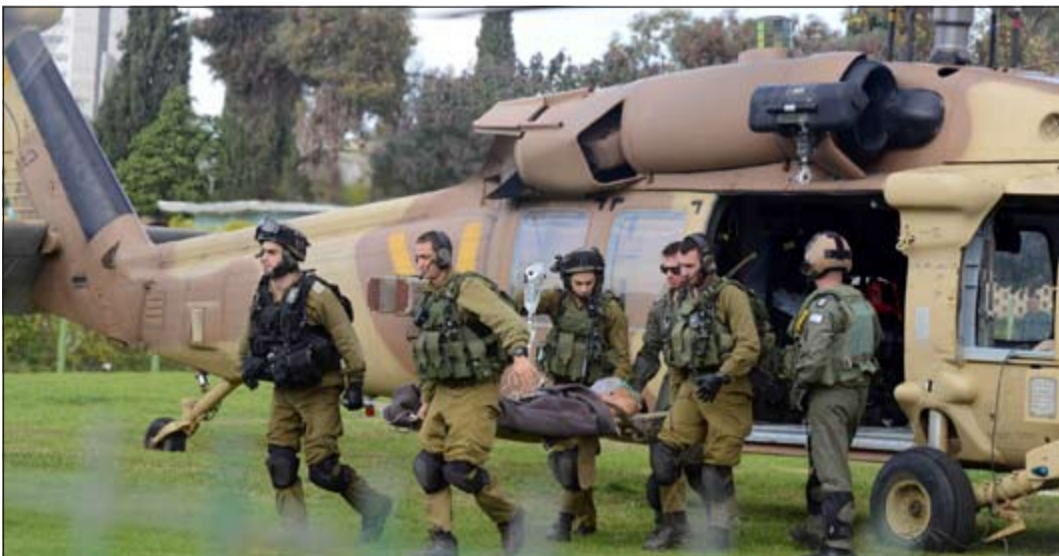
جنود إسرائيليون يحملون زميلهم المصاب بنار قناصة فلسطينيين أمس