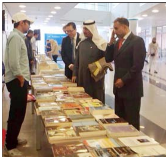
.. وخلال زيارته لمعرض «يوم اللغة العربية»