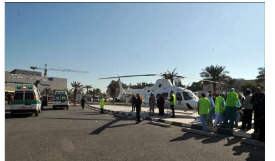
سيارات الإسعاف والإسعاف الجوي خلال عملية الإخلاء