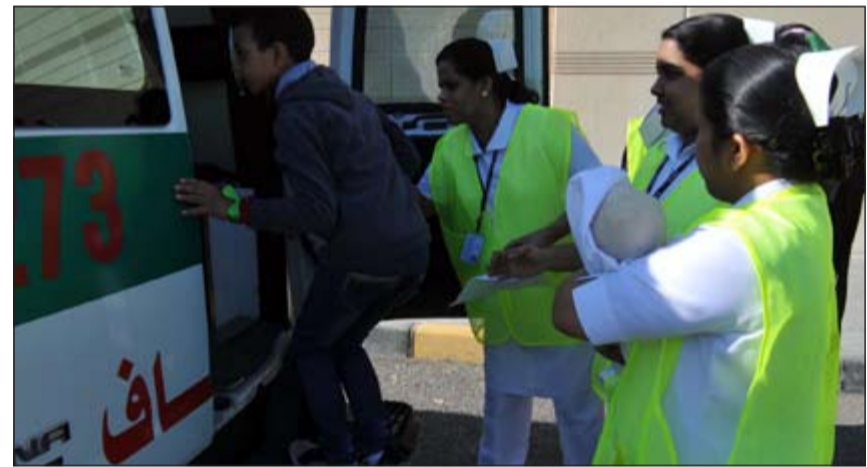
جانب من عملية الإخلاء

التمرين يأتي انطلاقا من حرص الوزارة على تطبيق خطة الطوارئ وجاهزية المستشفيات لإخلاء واستقبال المرضى والمصابين وتدريب الطواقم الطبية والإدارية من المستشفيات وفنيي الطوارئ الطبية على عملية الإخلاء ومدى استعداد العاملين على فرز المصابين والمرضى