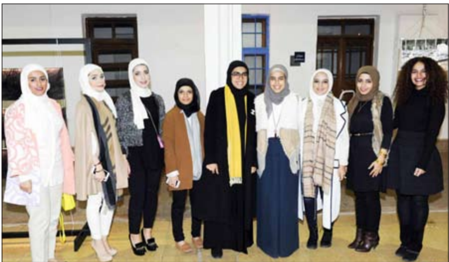
جانب من المشاركين بالمعرض

والأسود، مشيرا إلى أن هذا المقرر يغطي جميع مبادئ التصوير. وأضاف أنه في نهاية الفصل الدراسي يتم عرض المشاريع النهائية للطلبة من خلال معرض التصوير الفوتوغرافي، حيث يعرض الطالب من خلاله مجسما أو مركبا فنيا مصنوعا من الصور وتعتبر هذه الفكرة جديدة في مجال التصوير بالكمبيوتر أن يتم إدخال الفن والعمارة في المشاريع. وفي الختام تقدم المهندس نواف العلي بالشكر الجزيل لمدير عام بيت لودان نهايةته ويساهم في تعليمهم كيفية التصوير وكيفية طباعة الصور وتحمضها وكيفية تغيير ألوان الصور وعملها باللون الأبيض