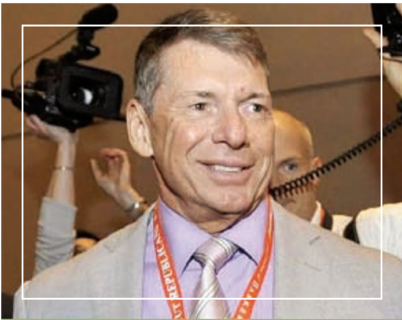
خسارة 500 مليون دولار

بعد الرئيس الروسي «فلاديمير بوتين» من بين الأثرياء على مستوى العالم، ولكن الانهيار الأخير للعملة الروسية «روبل» تسبب في خسائر فادحة لاستثماراته واقتصاد البلاد بوجه عام، بالإضافة إلى أن ما عزز الخسائر هو انخفاض أسعار النفط التي تراجع هذا العام بأكثر من 45% والعقوبات التي فرضها الغرب بسبب التدخل في الأزمة الأوكرانية، وكان من الصعب حساب مدى الخسائر المالية التي تكبدها «بوتين» لسرية ممتلكاته.