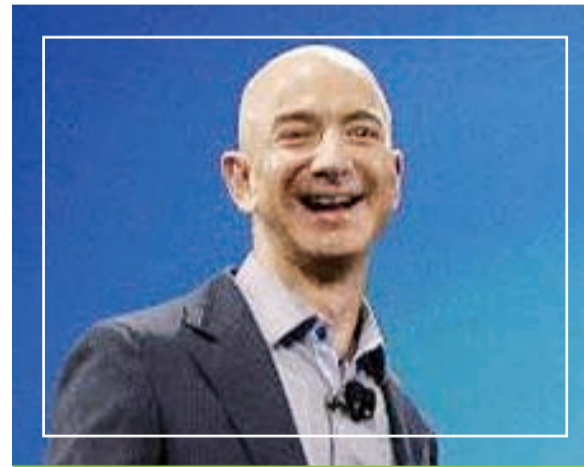
الثروة المتبقية 7,5 مليارات!

تعرضت شركة «ورلد ريسيتلينج إنترتينمنت - دبليو دبليو إي» التي أسسها «فينس مأكاهون» وترأس إدارتها التنفيذية، لتقلبات قوية هذا العام، حيث ارتفع سهم الشركة بداية 2014 وسقط آمال انعقدت على شراء شبكة تلفزيونية، إلا أن السهم انخفض مرة أخرى بعد أن خابت آمال الأسواق إزاء الصفقات المحتملة. وقد صنفته مجلة «فوربس» كأحد المليارديرات على مستوى العالم في يناير الماضي، ولكنه خسر حوالي 500 مليون دولار نتيجة انخفاض أسهم شركته في غضون أشهر قليلة.