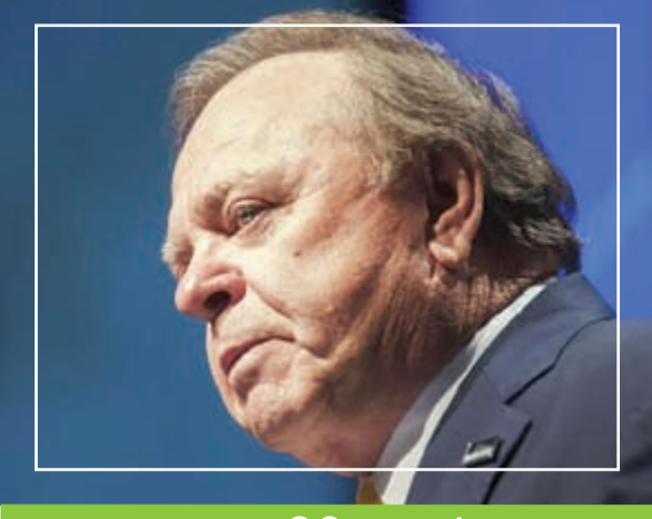
الخاسر الأكبر بـ 6,2 مليارات دولار

الملياردير جيف بيزوس اشترى إحدى الصحف ذائعة الصيت عالميا «واشنطن بوست» في وقت سابق هذا العام، ولكن مصدر ثروة «جيف بيزوس» هو موقع التجارة الإلكترونية «أمازون» دوت كوم» الذي انخفضت أسهمه بنسبة 23% في عام 2014، ولا يزال الموقع رائدا في هذا المجال، إلا أن صعود متاجر مثل «وول مارت» و«تارجت» يهدد مكانته. ويمتلك «بيزوس» حوالي 84 مليون سهم أو بنسبة 18% في «أمازون»، وتسبب انخفاض السهم في خسارة أكثر من 7,5 مليارات دولار، إلا أنه لا يزال يمتلك ثروة بحوالي 25 مليار دولار.