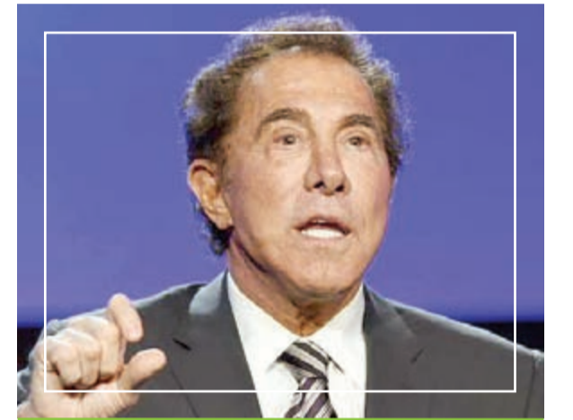
فقط 500 مليون دولار

لم يكن 2014 بعام الحظ بالنسبة إلى مجموعة كبيرة من مليارديرات العالم، فإذا كان البعض قد ضاعف ثروته، فإن البعض الآخر قد تكبد خسائر فادحة. وقد كشف موقع «ياهو فاينانس» النقيب عن 10 أشخاص تكبدوا أكبر خسائر خلال 2014، نقلته «أرقام»، بالنظر إلى حجم المخاطر التي واجهوها وعائد الاستثمارات بالإضافة إلى الأحوال الاقتصادية والمالية المحيطة بهم.