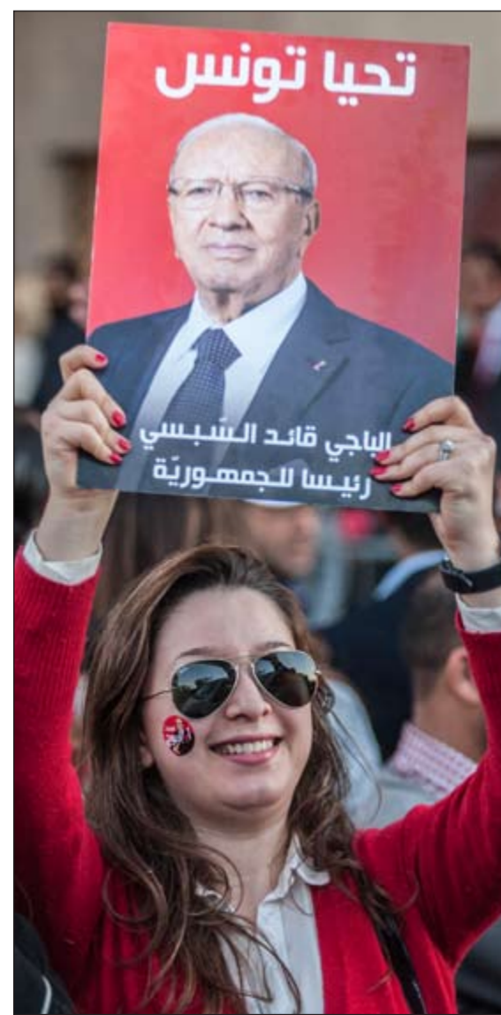
مؤيدة للسبسي ترفع صورته احتفالاً بفوزه امس الاول

وفي غضون ذلك، أعلن نائب رئيس الهيئة العليا المستقلة للانتخابات التونسية نبيل بفون أن الهيئة ستعلن النتائج النهائية للانتخابات الرئاسية يوم الجمعة المقبل في حال عدم تقديم أي طعون على العملية الانتخابية وقال بفون في تصريح له امس إنه في حال عدم تقديم طعون فإن الهيئة ستحصل على شهادة بهذا المعنى من المحكمة الإدارية، ويتم عقب ذلك الإعلان الرسمي عن النتائج النهائية.