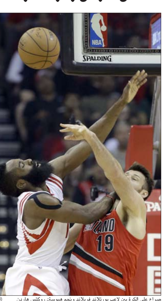
صراع على الكرة بين لاعب بورتلاند فيرلاند ونجم هيوستن روكتس هاردن