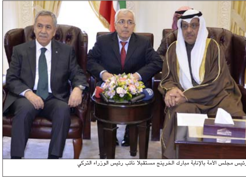
رئيس مجلس الأمة بالإتابة مبارك الخرينج مستقبلا نائب رئيس الوزراء التركي