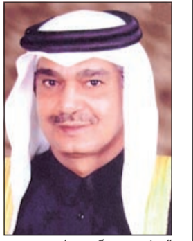
السفير حمد آل حنزاب

يعتذر سفير دولة قطر الشقيقة حمد بن علي آل حنزاب عن عدم استقبال رواد الديوانية اعتباراً من اليوم الأربعاء وحتى إشعار آخر على أن يعاود استقبالهم في موعد يحدد لاحقاً.