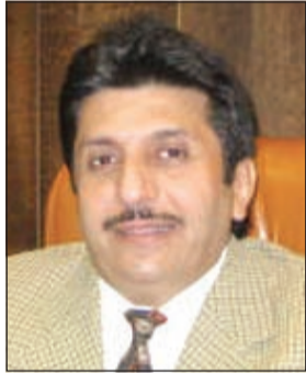
السفير ناصر المزين

وقال وكيل وزارة الخارجية البحرينية للشؤون الإقليمية ومجلس التعاون حمد العامر في كلمة افتتاح الاجتماع التحضيري ان هذا الاجتماع يهدف الى تعزيز العلاقات الثنائية وتطويرها الى المستويات التي تهدف اليها القيادة السياسية في كلا البلدين.