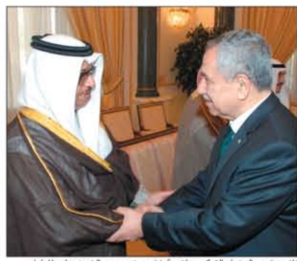
نائب رئيس الوزراء التركي بولنت ارئش يعزي سمو الشيخ جابر المبارك

صاحب السمو وولي العهد أسرة آل الصباح الكرام استقبلوا المعزين في وفاة الشبيخة شيخة صباح الناصر 04