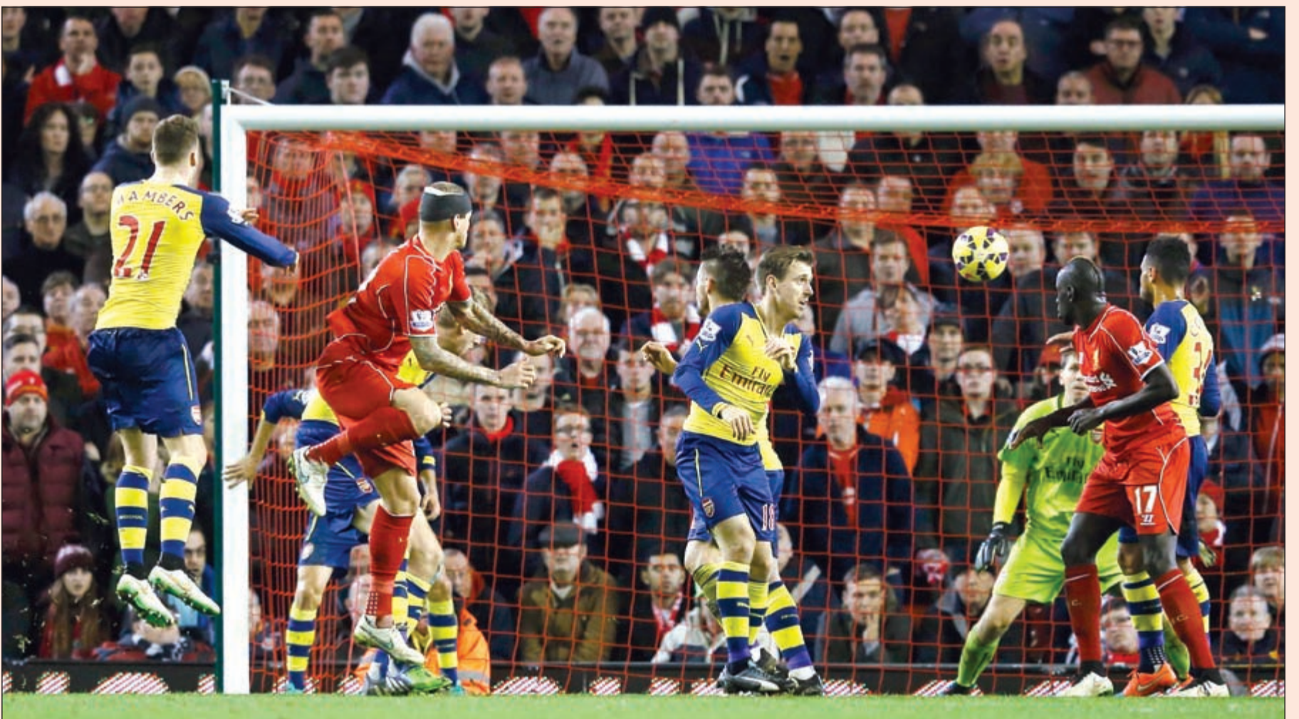
راسية سكرتل القتالة في طريقها لهز شبك أرسنال