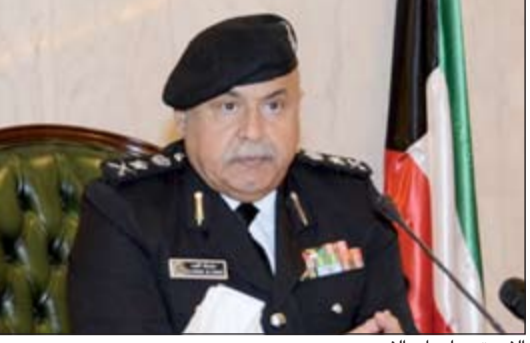
الفريق سليمان الفهد

وأضاف الفريق سليمان الفهد ان حرية الاختيار متاحة لجميع الضباط وبكل التقدير والاحترام لسنوات الخدمة والجهود التي بذلوها كذلك الحال لمن يرغب في الاستمرار والبقاء في الخدمة، لافتا الى ان الوزارة تعمل وفق إطار مؤسسي ومنهجي قائم على الاحلال والتبديل كما هو متبع في أعرق المؤسسات الأمنية في العالم، على اعتبار ان التقاعد سنة الحياة، لذلك استمر في خطط وبرامج اعداد وتدريب وتأهيل صفوف من القيادات العليا والوسطى والصغرى ولدينا من الكوادر الأمنية المؤهلة على درجة عالية من التخصص والتي تملك الخبرات والتجارب العملية والميدانية لتولي المناصب في مختلف المواقع بلا حساسية فلا يوجد لدينا ما يسمى بالفراغ ولا تنسرك الأمور لتظروف وليس هناك شيء دائم والكل يخضع لحركة التغيير للأفضل والأصلح،