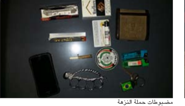
مضبوطات حملة النزمة