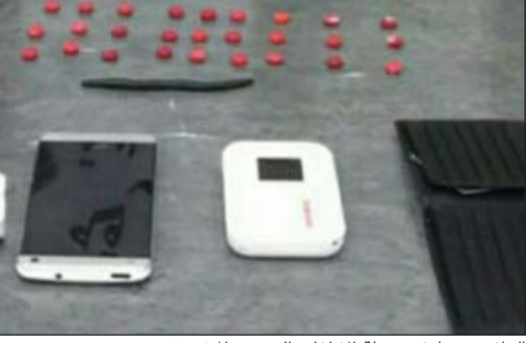
الوافد ضبط في حملة الإطفاء بالحروب المخدرة

دخان كثيف انبعث من داخل مركبة خلال نقطة تفتيش في منطقة النزمة الى اكتشاف رجال الأمن لمواد مخدرة بحوزة شايفين الى جانب ادوات تعاط.