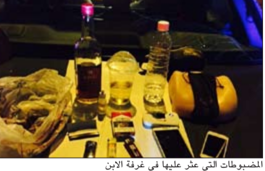
المضبوطات التي عثر عليها في غرفة الابن