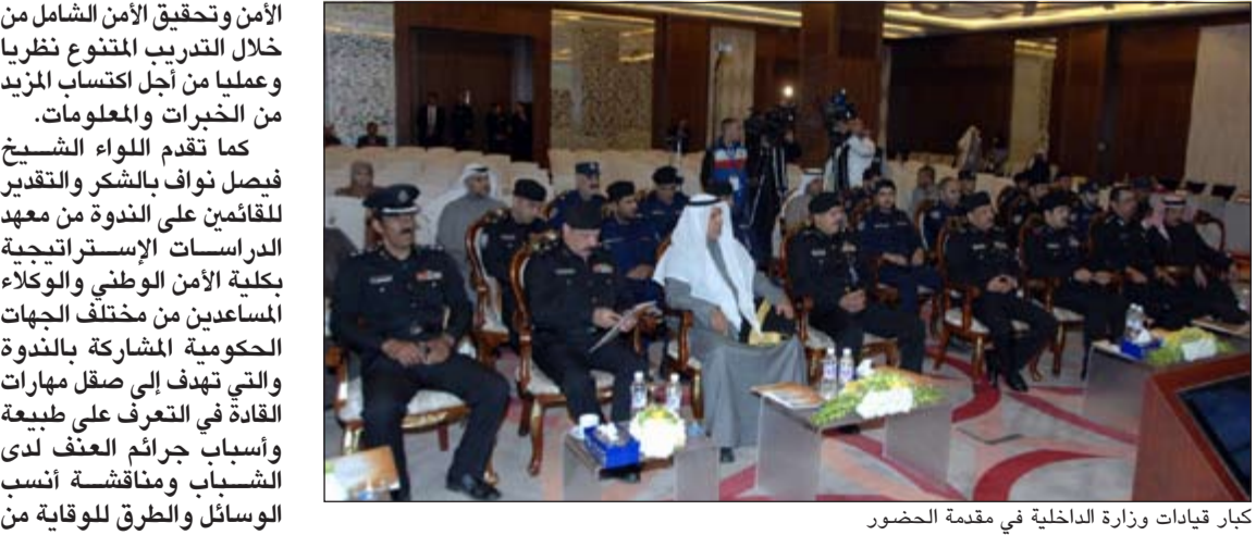
كبار قيادات وزارة الداخلية في مقممة الحضور

رئيس مجلس الوزراء ووزير الداخلية الشيخ محمد الخالد ووكيل وزارة الداخلية الفريق سليمان الفهد، مؤكدا العمل على تفعيل كل ما من شأنه الارتقاء بمستوى أداء رجال