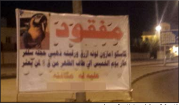
اللوحة التي أعادت الطائر إلى صاحبه

الإعلان الذي كان يوم الخميس وأعاد له المواطن يوم أول من امس بعد أن شاهده اللوحة الإعلانية وقام بالاتصال على مالك الطائر وارجاع الكاسكو إليه.