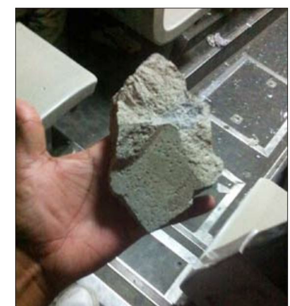
طابوقة استخدمت في تفشي زجاج الباص

ان نزل الشابين واعمارهما نحو 20 عاماً فوجئ بهما يقذفان الباص بالطابوق وهشما زجاجه.