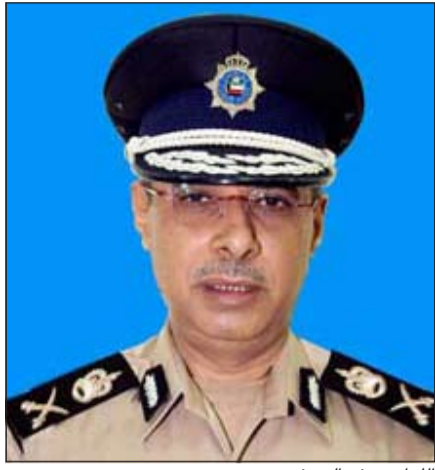
اللواء سيف السيف