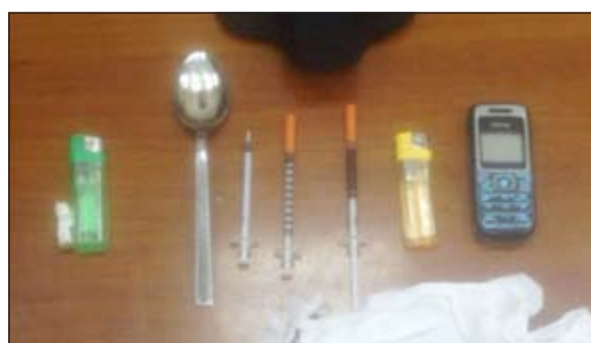
أدوات التعاطي وإبر الهيروين ضبطت مع المطلوب ومرافقه في الجليب