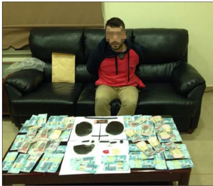
الوافد السوري وامانه المضبوطات

بعد أن تسلّم المتهم المبلغ المرقم وسلم الحشيش، وبتفتيشه وسيارته عثر معه على المضبوطات الواردة ذكرها.