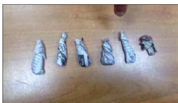
المخدرات المضبوطة في المطار