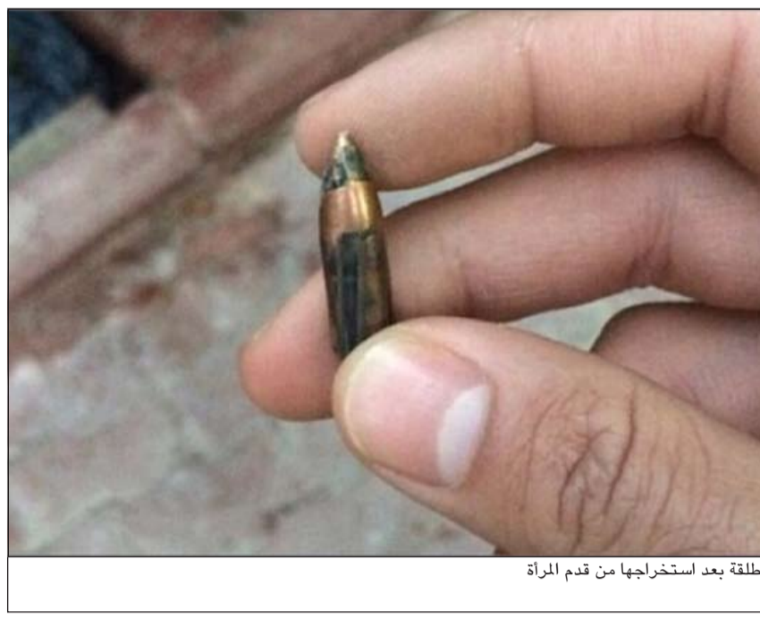
الطلقة بعد استخراجها من قدم المرأة

أحال مراقب عام مطار الكويت الدولي سليمان الفهد إلى الإدارة العامة لمكافحة المخدرات وأفاد بنغالبا بعد ان ضبط من قبل فريق الجولية بعد الاشتباه به وبتفتيش أمتعته عثر رجال الجمارك على 6 لفافات بها حشيش. كما تمكن رجال أمن الفروانية من ضبط مواطن وشخص من غير محدد الجنسية في الجليب لكونهما تحت تأثير تعاطي المواد المخدرة وتم التحفظ على موائد مخدرة وأدوات تعاط، وقال مصدر أمني ان دورية اشتبهت في سيارة بداخلها شخصان كانا في حالة غير طبيعية وتبين وجود أدوات تعاط ومخدرات كما تبين من خلال الاستعلام الجنائي عن الموقوفين أن أحدهما مطلوب للحبس 5 سنوات.