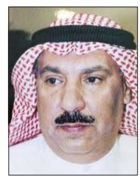
العميد عبدالرحمن الصهيل

أحال مدير عام الإدارة العامة للمباحث الجنائية اللواء محمود الطباخ وأفاد سوريا إلى نيابة المخدرات لاتجاره في المواد المخدرة وحيارته.