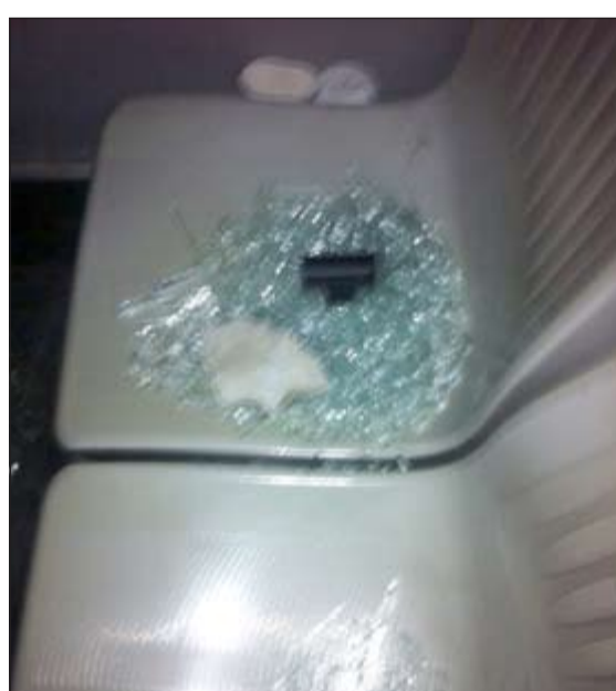
الزجاج مبعثر على مقاعد الركاب

وبحسب مصدر أمني فإن السائق المحني عليه وهو آسيوي قال في مخفر الاندلس انه كان في طريقه إلى منطقة جليب الشويخ ومقابل الإفنيوز فوجئ بالشابين يطلبان منه التوقف في الشارع العام حتى يقوموا بالنزول، وأضاف السائق ابغت الشابين بأن