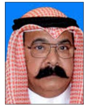
اللواء محمود الطباخ

استطاع رجال مباحث حولي إقناع المتهم بشراء كمية من الحشيش وتم الاتفاق على أن يكون التسليم والتسليم في الثالثة فجراً، ليتم ضبطه