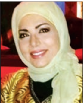
الإعلامية نادية صقر