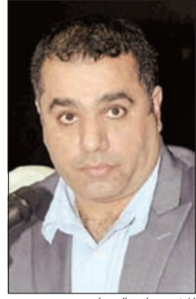
المخرج هاني النصار