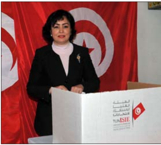
ناخبة تونسية تدلي بصوتها