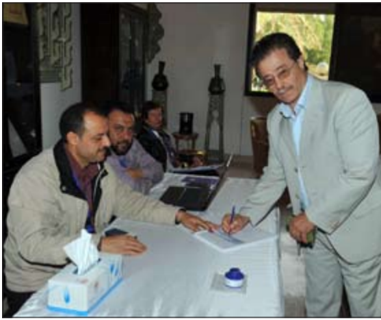
أحد الناخبين يدلي بصوته