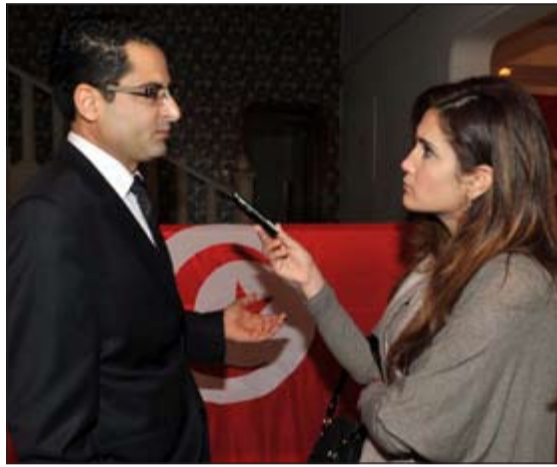
السفير نور الدين الري متحدنا للزميلة بيان عاكوم