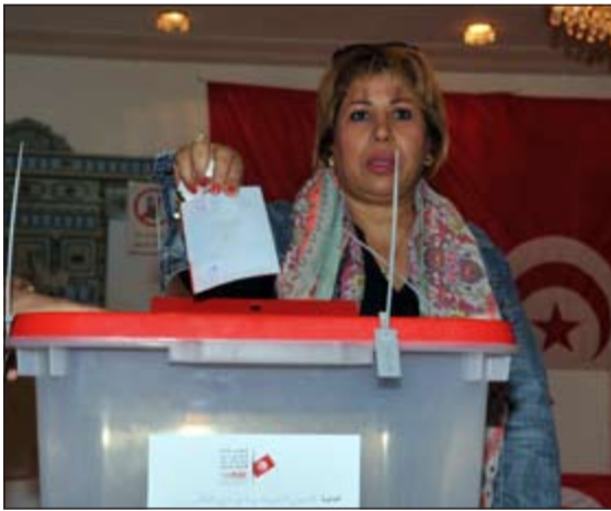
إحدى الناخبات أثناء الإدلاء بصوتها