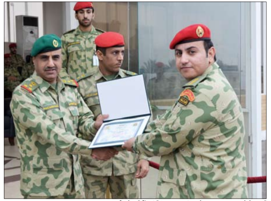
العميد الركن زيد محمد زيد بكرم خريجي دورة الشرطة العسكرية

جميع الحقوق الاجتماعية والاقتصادية والسياسية، ويحمي الفرد والمجتمع»، لافتا إلى أنهم وفقوا في تجاوز جميع المراحل للوصول إلى هذا اليوم. وعن الجالية التونسية في الكويت، ذكر السفير الري «أن عددها يصل إلى 3600 تونسي، ومن يحق لهم التصويت 2010 مواطنين»، متمنيا «مشاركة الجميع في صنع غد تونس المشرق»، معبرا عن تفاؤله بمستقبل بلاده، حيث قال «اننا استطعنا تجاوز تحديات اقتصادية واجتماعية، فمن باب أولى أن نتجاوز ما تبقى من تحديات في مرحلة المؤسسات الدائمة». وعن تحدي الإرهاب، قال الري «لقد استطاع الشعب التونسي ضرب جميع الخلايا الإرهابية التي حاولت التعدي علينا»،