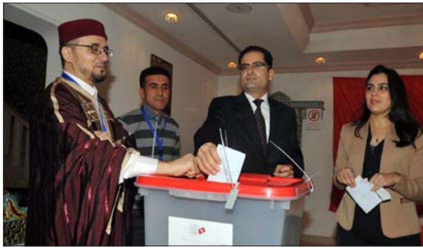
السفير التونسي د. نور الدين الري خلال إدلائه بصوته (فاسم باشا)