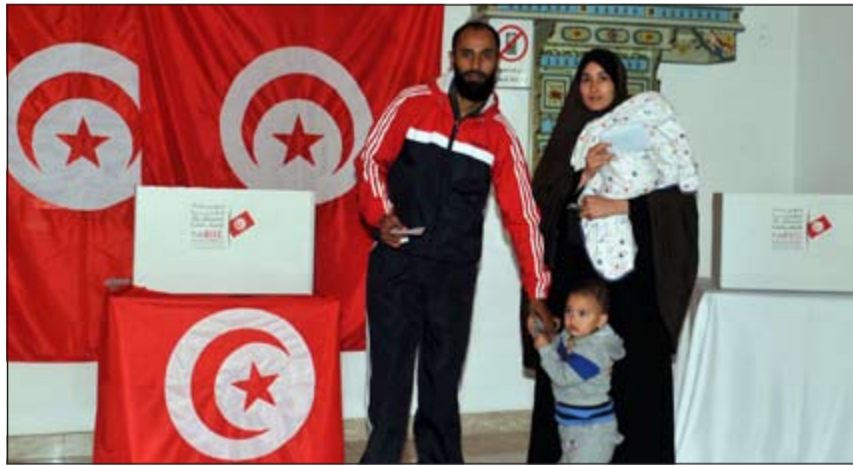
أسرة خلال مشاركتها في العملية الانتخابية