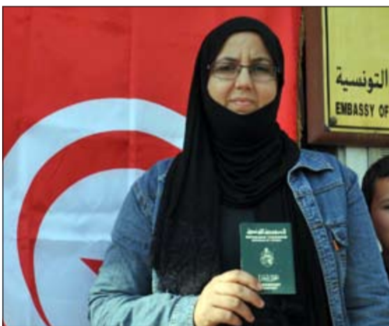
تونسية ترفع جواز السفر التونسي