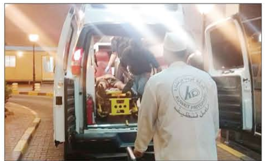
أحد المسابن في الحريق لدى وصوله إلى مستشفى الفروانية