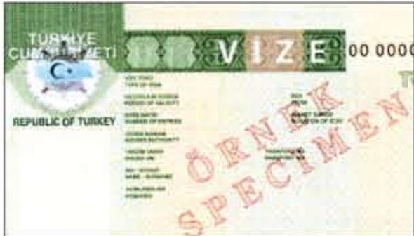
صورة عن التأشيرة الجديدة

وبناء عليه سيتم إعفاء المواطنين الكويتيين ممن يحملون التأشيرات المشار إليها من شرط الحصول على تأشيرة لدخول للأراضي الصربية. وإدارة الإعلام الأمني تهيب بالمواطنين ضرورة الانتباه قبل السفر والتأكد من حصولهم على التأشيرات المعفاة أو الحصول على تأشيرة دخول صربيا.